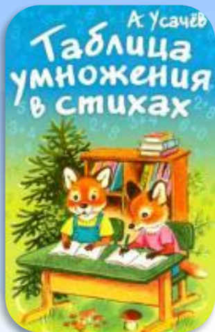
Таблица умножения на 8