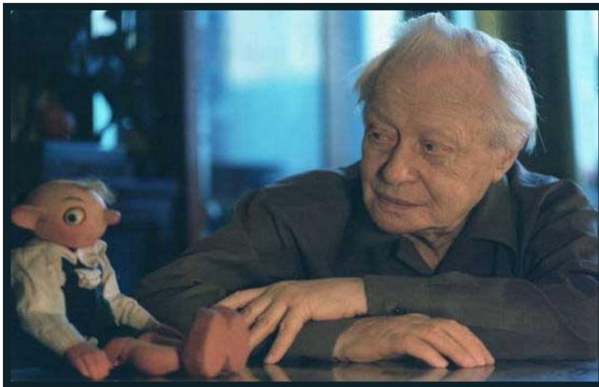
Сергей Владимирович Образцов