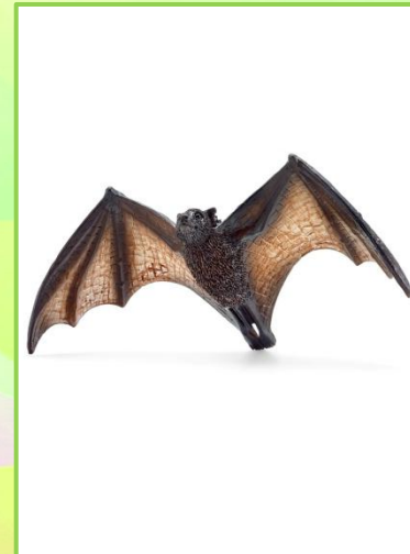
4. ЛЕТУЧАЯ МЫШЬ