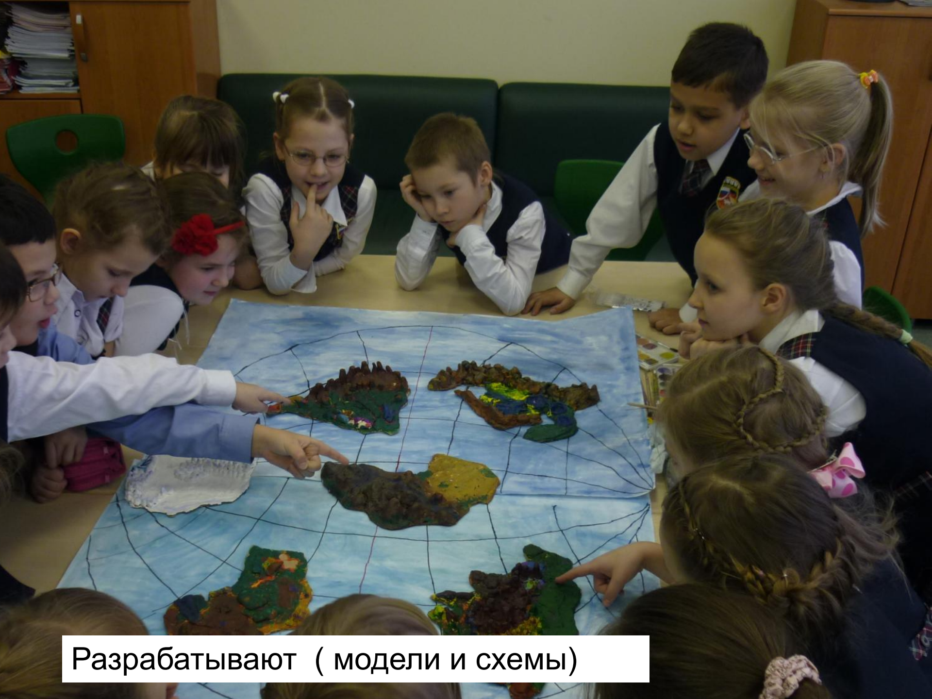
Разрабатывают ( модели и схемы)