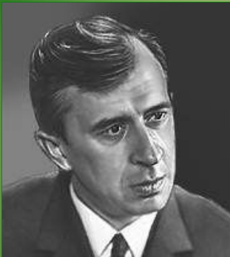
Анатолий Владимирович Жигулин (1930 – 2000)