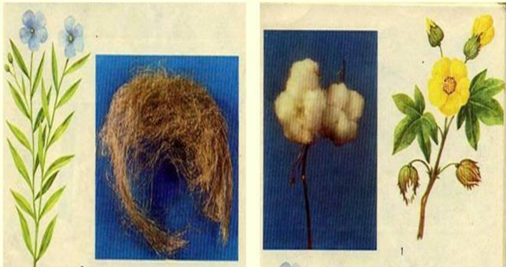
Иллюстрация из учебного пособия «Обслуживающий труд» для 5 класса А.Я. Лобазина

Для каких тканей являются сырьем эти растения?