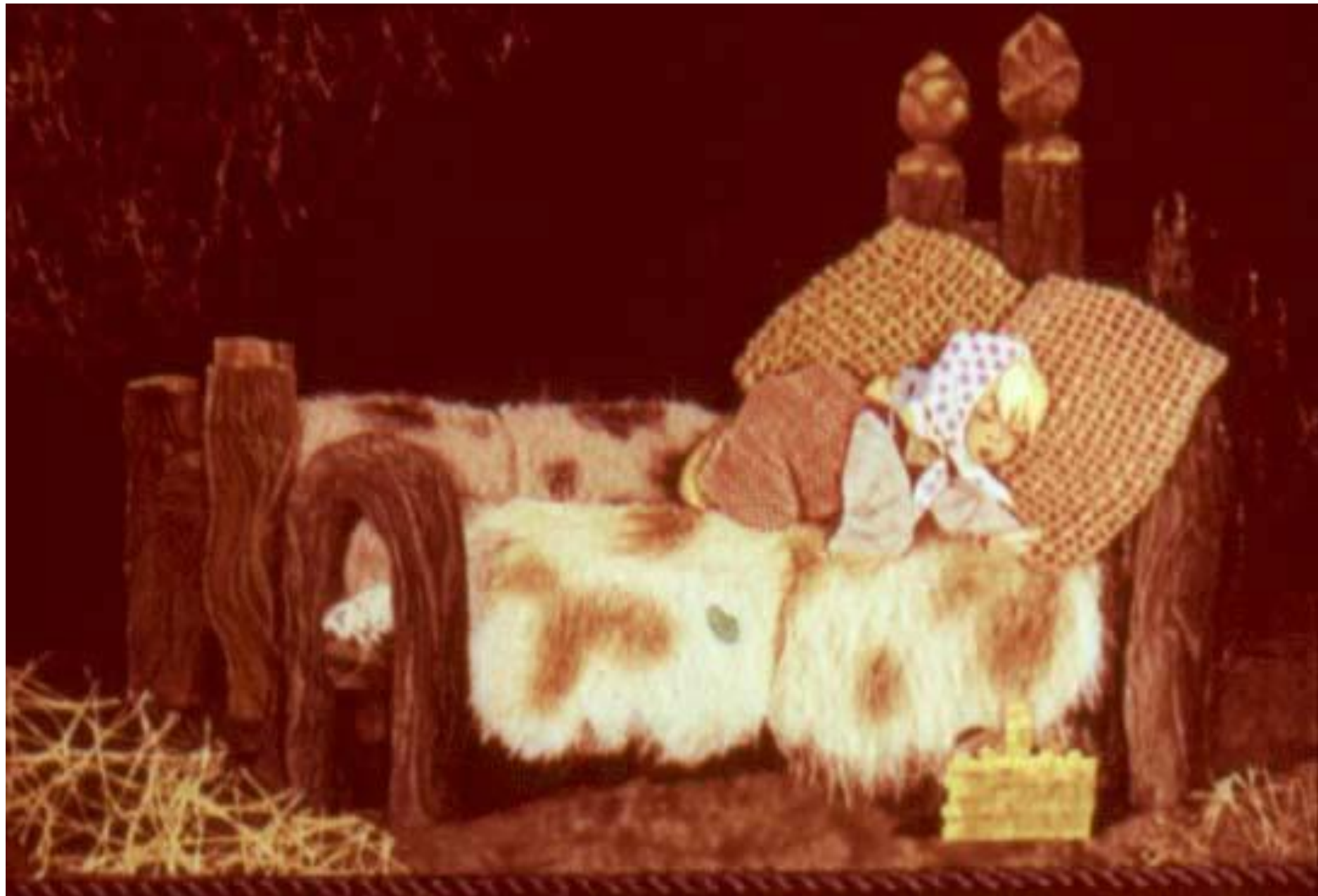
легла в среднюю — было слишком высоко;