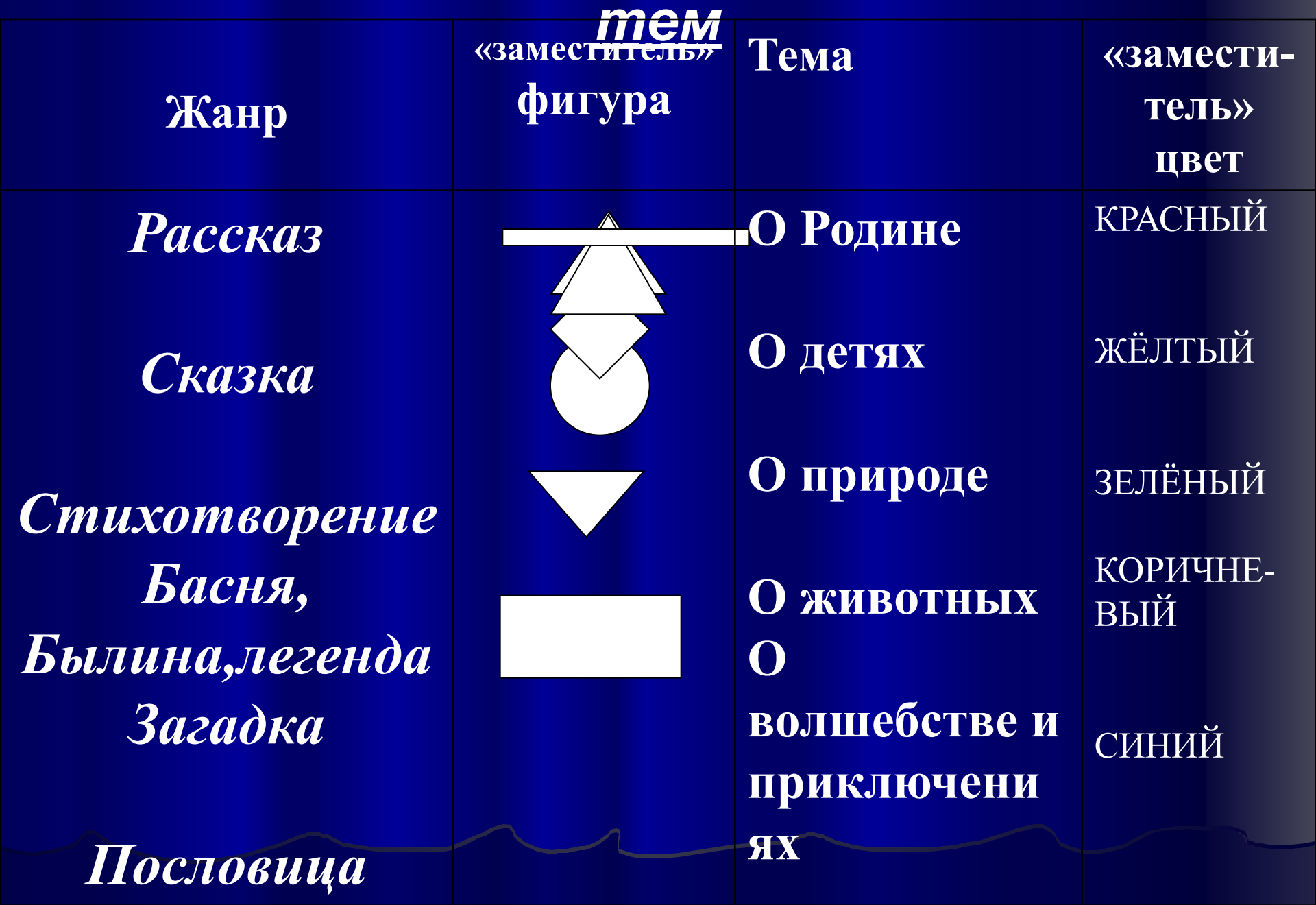
Таблица «заместителей» жанров и