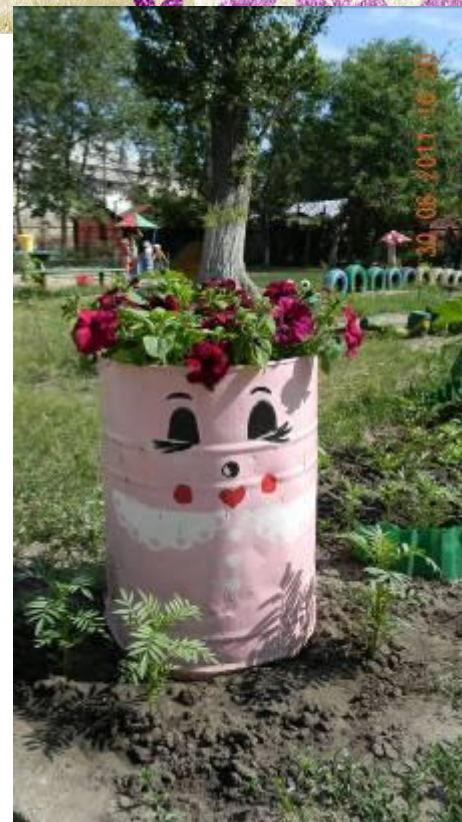
Клумба « Сладкая парочка»