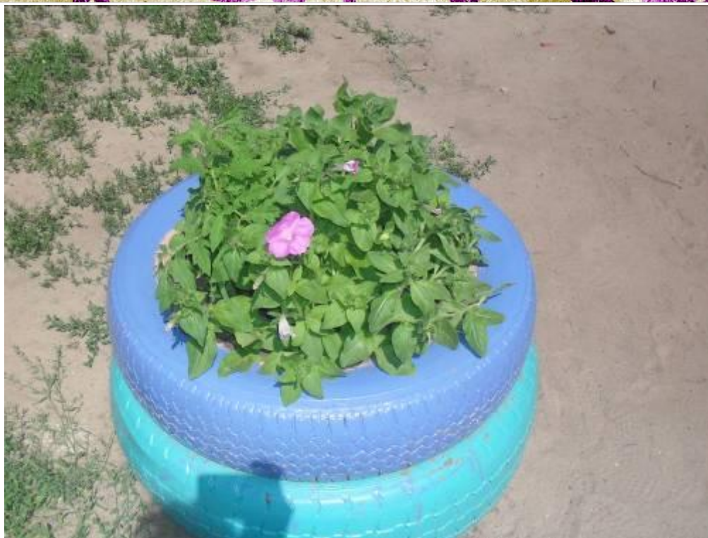
Круглые клумбы на участке детского сада