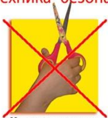
Не держи ножницы концами вверх.