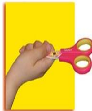
Передавай ножницы в закрытом виде кольцами в сторону товарища.