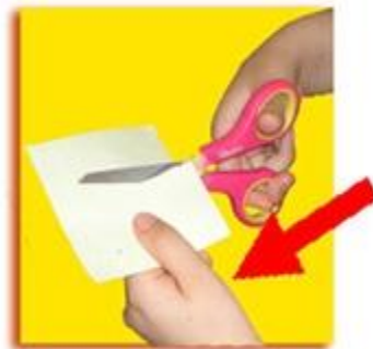
При работе следи за пальцами левой руки.