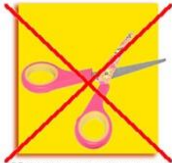
Не оставляй ножницы в открытом виде.