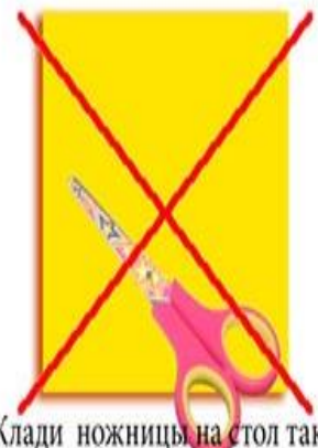
Клади ножницы на стол так, чтобы они не свешивались за край стола.