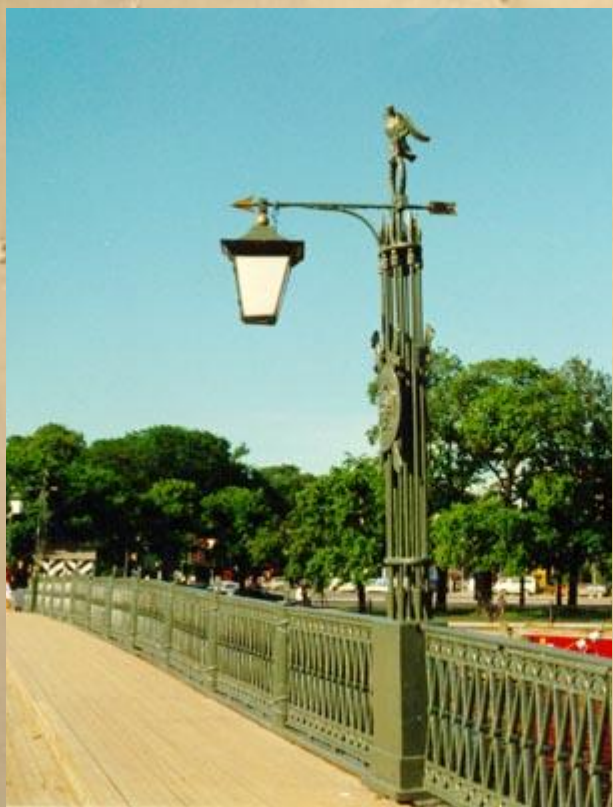
Фонарь Иоанновского моста через Кронверкский проток

Многие петербургские мосты украшены фонарями, которые тоже стали городскими символами.