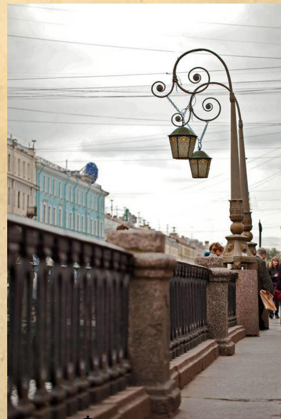
Фонари на Итальянском мосту через канал Грибоедова