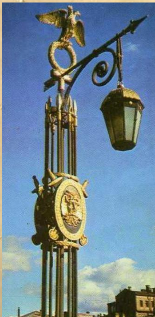
Фонарь моста Пестеля через Фонтанку