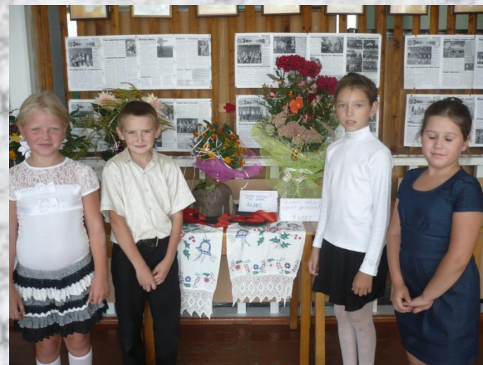
2015 конкурс цветочных композиций