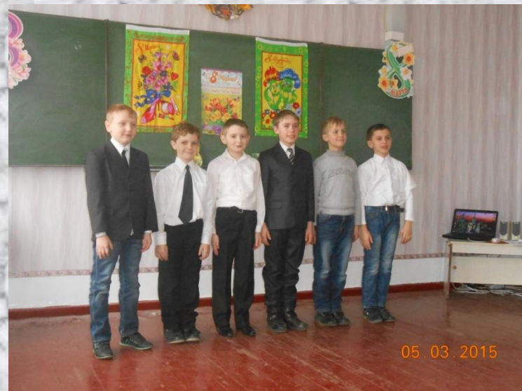
2015 8 Марта