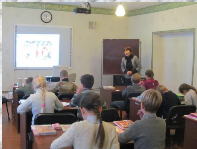
2015 Урок русского языка «Имя существительное (обобщение знаний)»