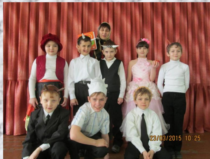
2015 Игра – путешествие «Безопасность дети – важней всего на свете»