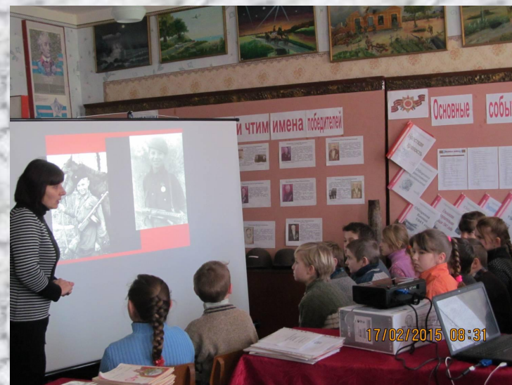
2015 Урок Мужества