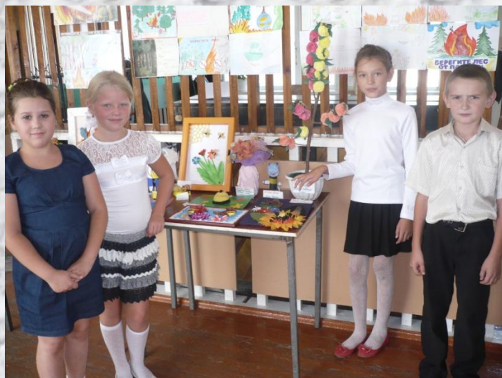
2015 конкурс «Золотая пчёлка»