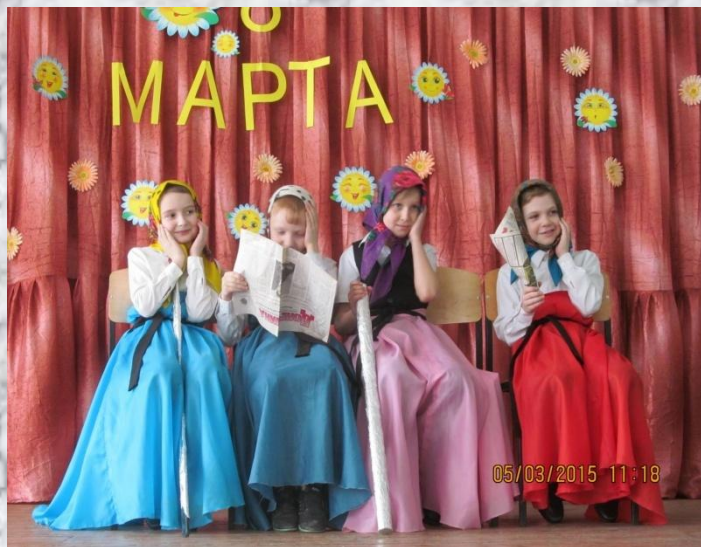
2015 концерт к 8 Марта