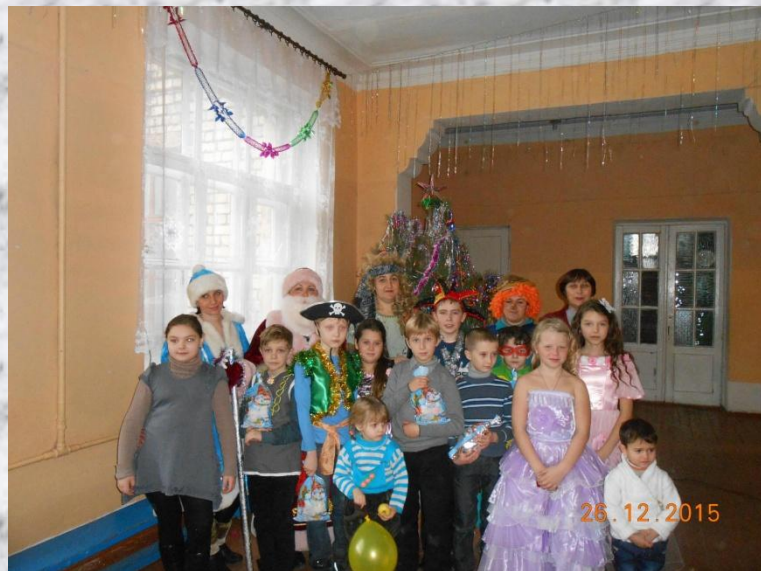
2015 Новый год