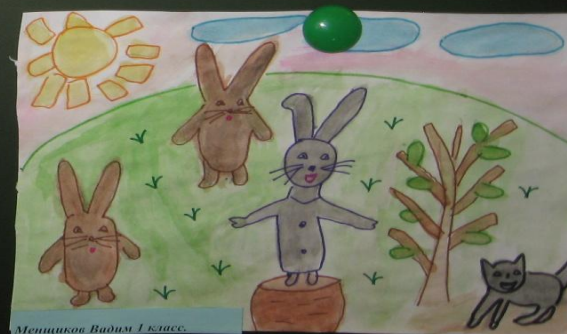
Мещников Вадим 1 класс.

Рисунки по мотивам любимых книг являются для ребенка одним из способов выражения своих впечатлений от произведений.