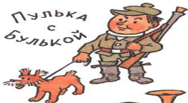
ПУЛКА С БУЛЬКОЙ