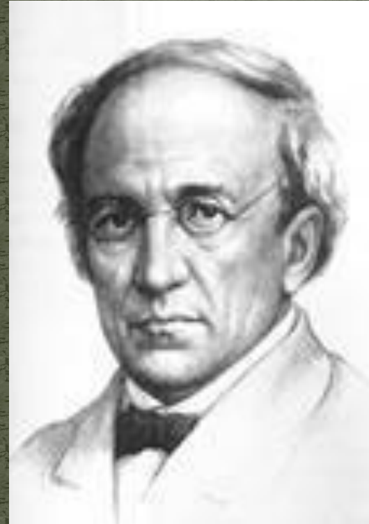
Фёдору Тютчеву 20 лет