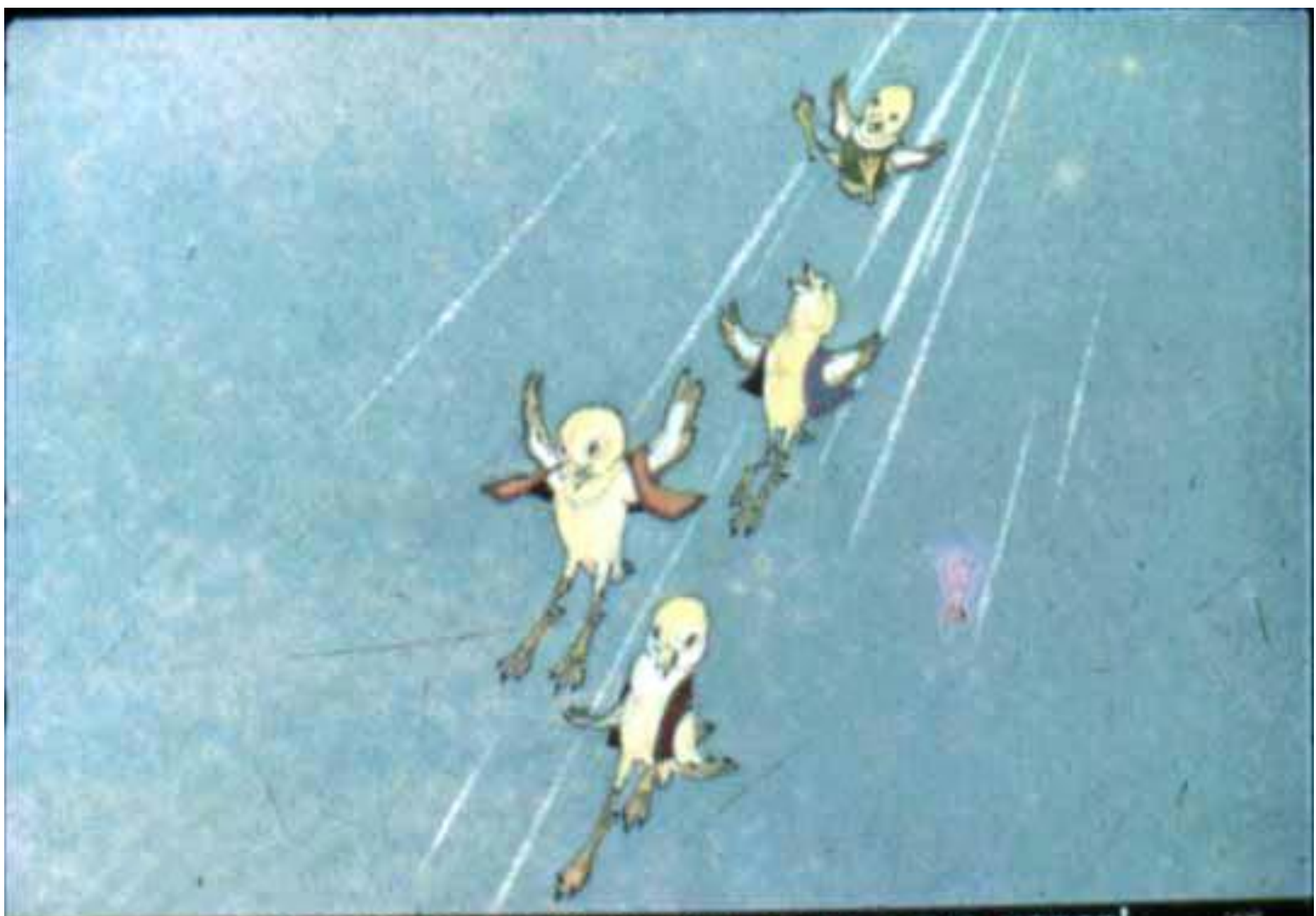
...цыплята на солнечном луче вниз летят!