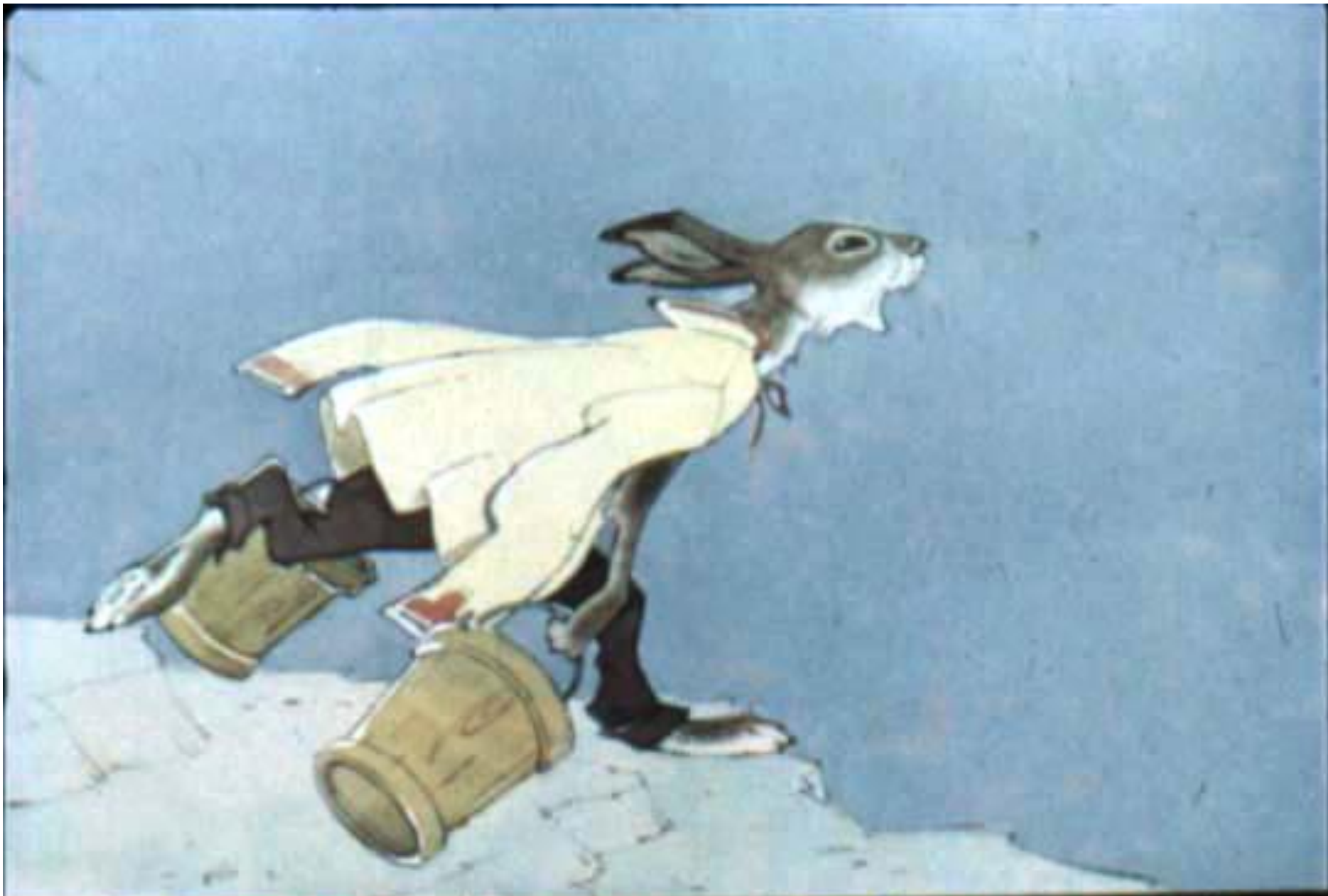
Заяц схватил вёдра и скорее побегал за водой.