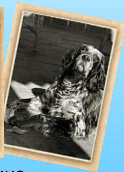
Музей – усадьба в деревне Дунино