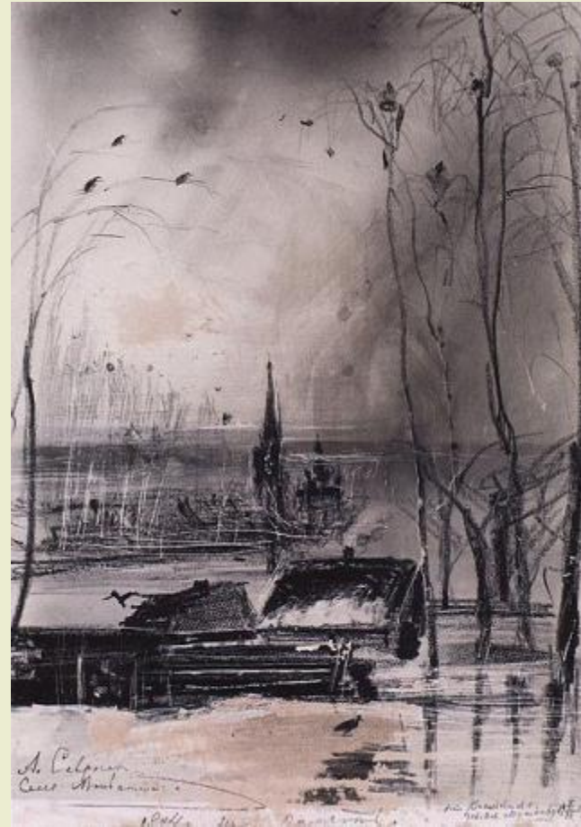
«Грачи прилетели. Пейзаж с церковью»