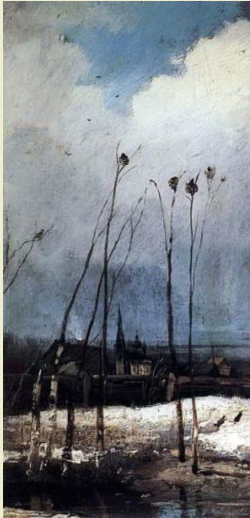
«Грачи прилетели» 1880-е годы 1894