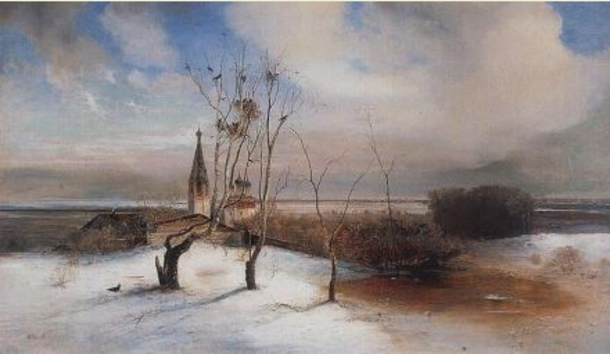
«Весна. Грачи прилетели» 1872