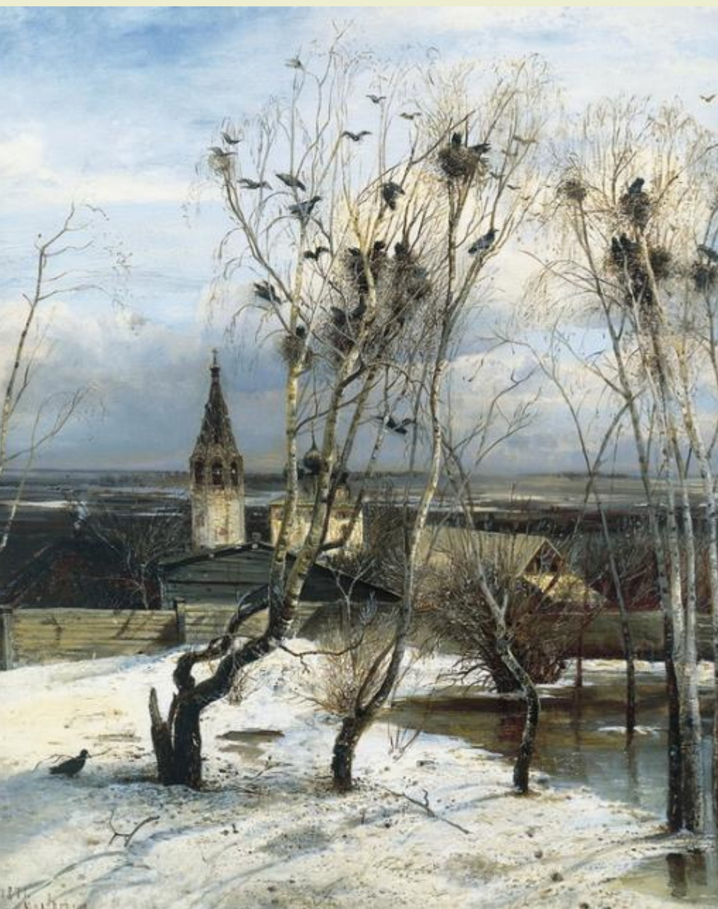
А.К. Саврасов «Грачи прилетели» 1871

Крамской объяснил, почему картина оказалась лучше всех других: у других художников тоже есть деревья, вода и даже воздух, но не более, «а душа есть только в «Грачах».