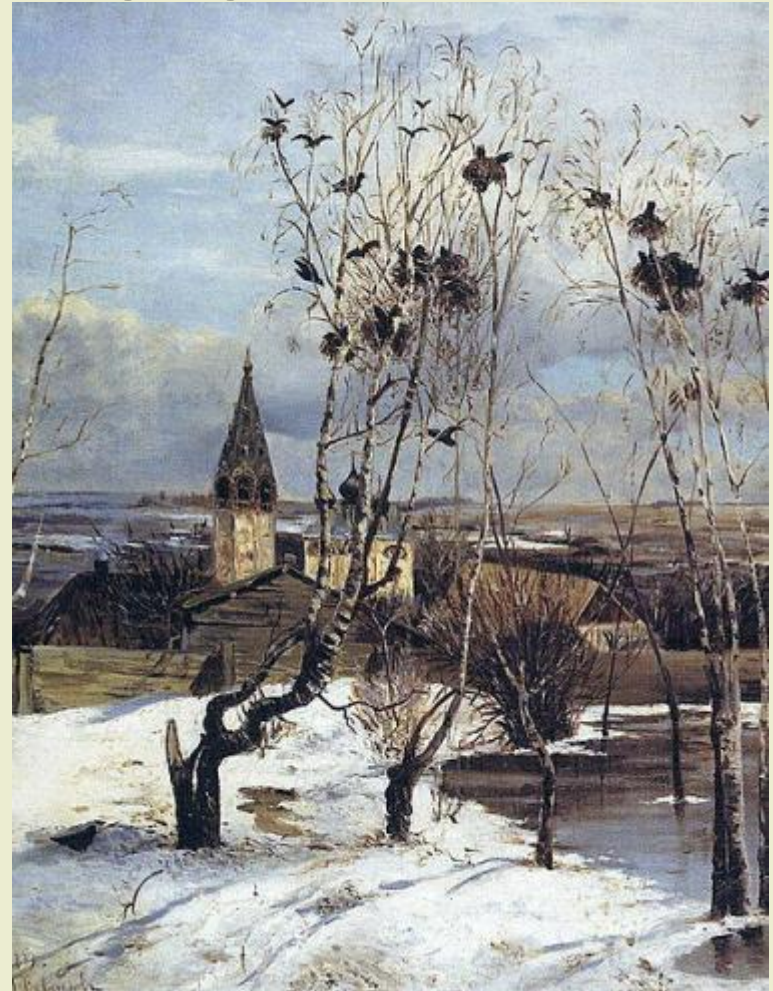
«Грачи прилетели» 1879