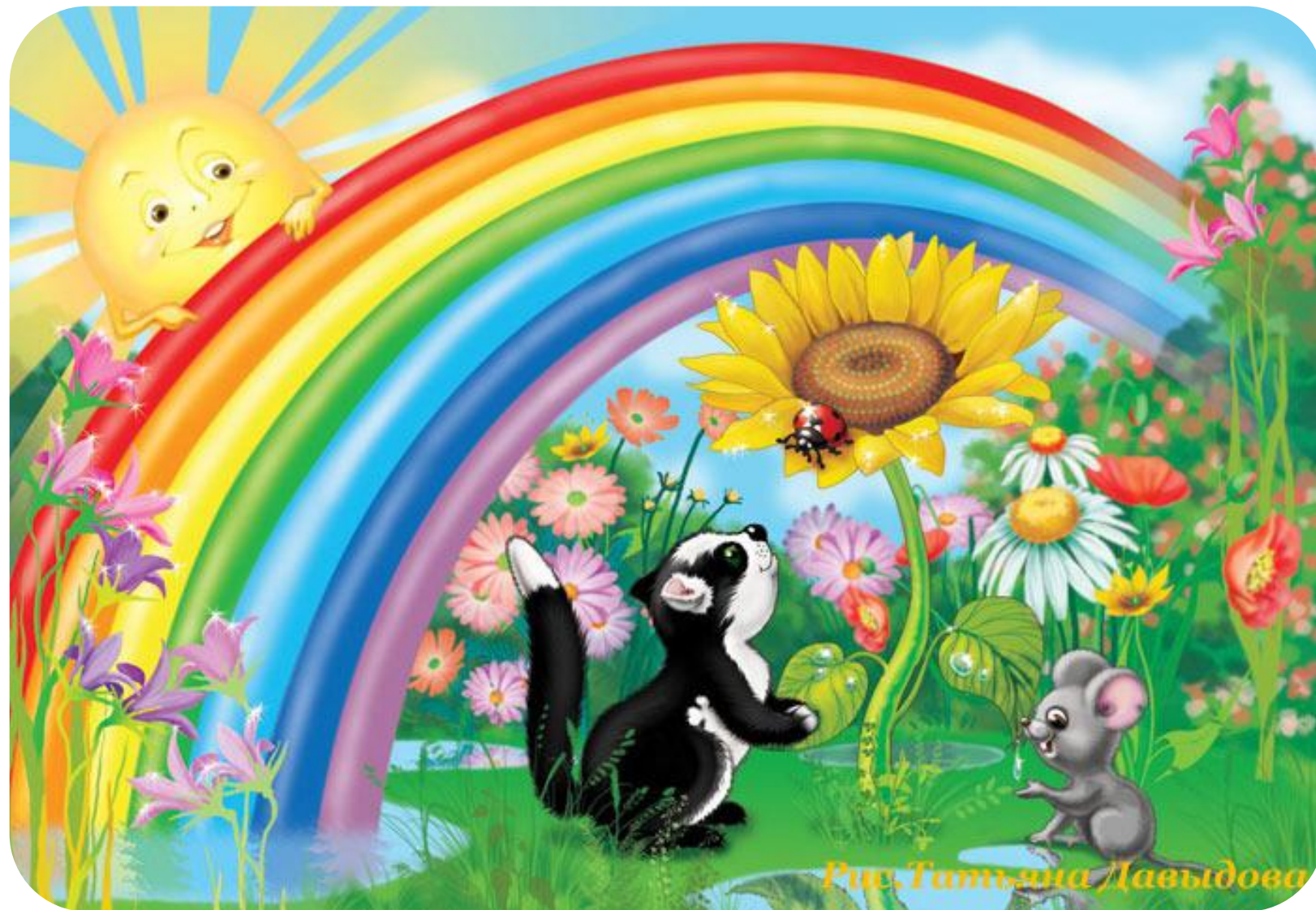
Рис. Татьяна Давыдова