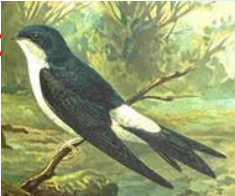
ласточка – вороник или городская ласточка