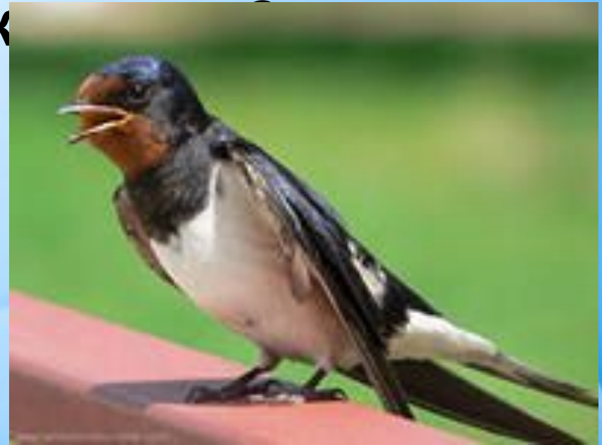
ласточка – касатка или деревенская