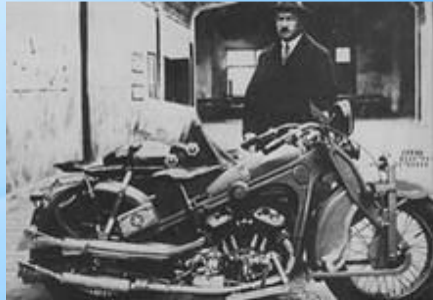
Советский мотоцикл ИЖ-1, 1929 г.