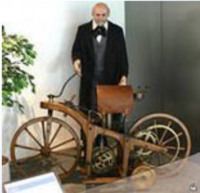
29 августа 1885 г. Готлиб Даймлер

Первый в мире мотоцикл за час мог проехать только 12 км, а первый отечественный мотоцикл проезжал в час на 58 км больше. Сколько километров в час проезжал первый отечественный мотоцикл?