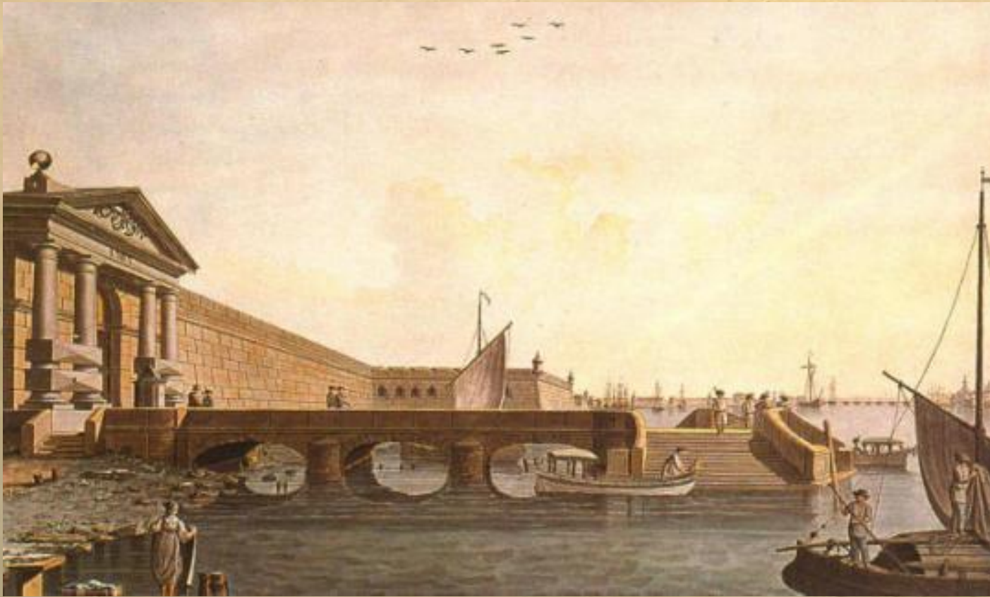
"Невские ворота Петропавловской крепости". Гравюра Б. Патерсена. Нач. 19 в.

Однако деревянные набережные быстро разрушались, и вскоре их стали заменять гранитными . Пространство между сваями заполняли камнями. Затем набережную облицовывали гранитными плитами.