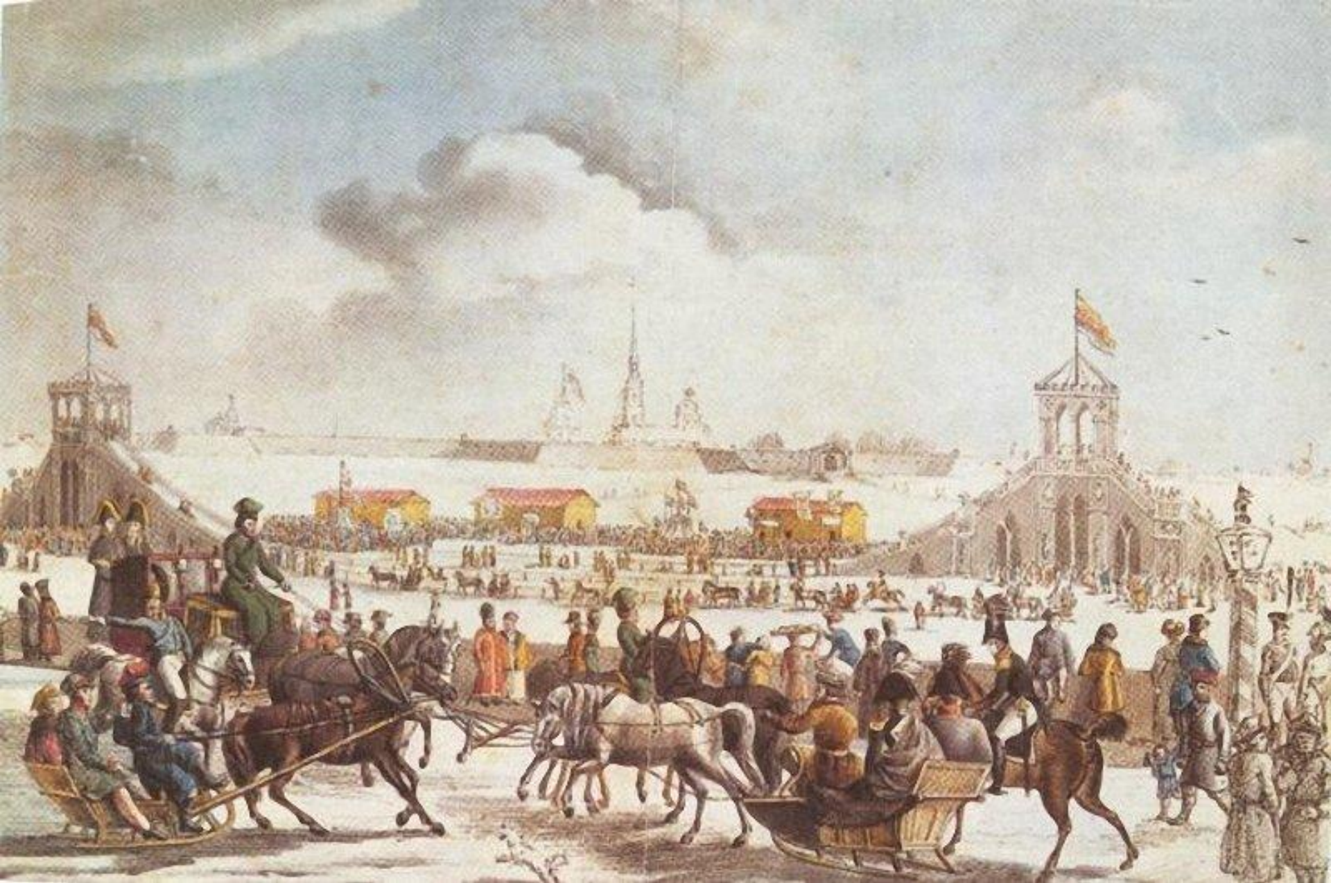
Никола Серракаприола Катальные горы на Неве (гравюра). 1817 г.