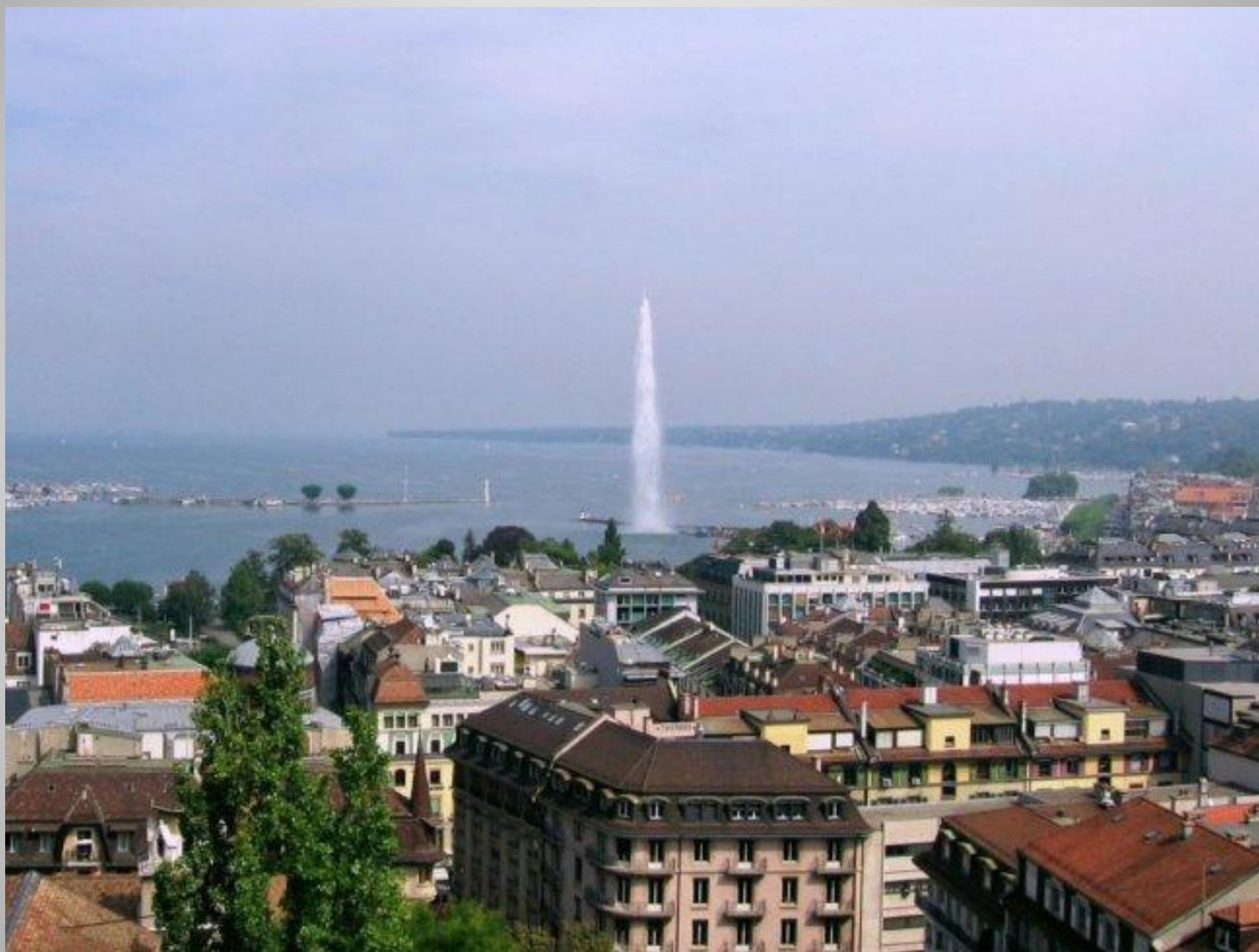
Швейцария - фото отелей