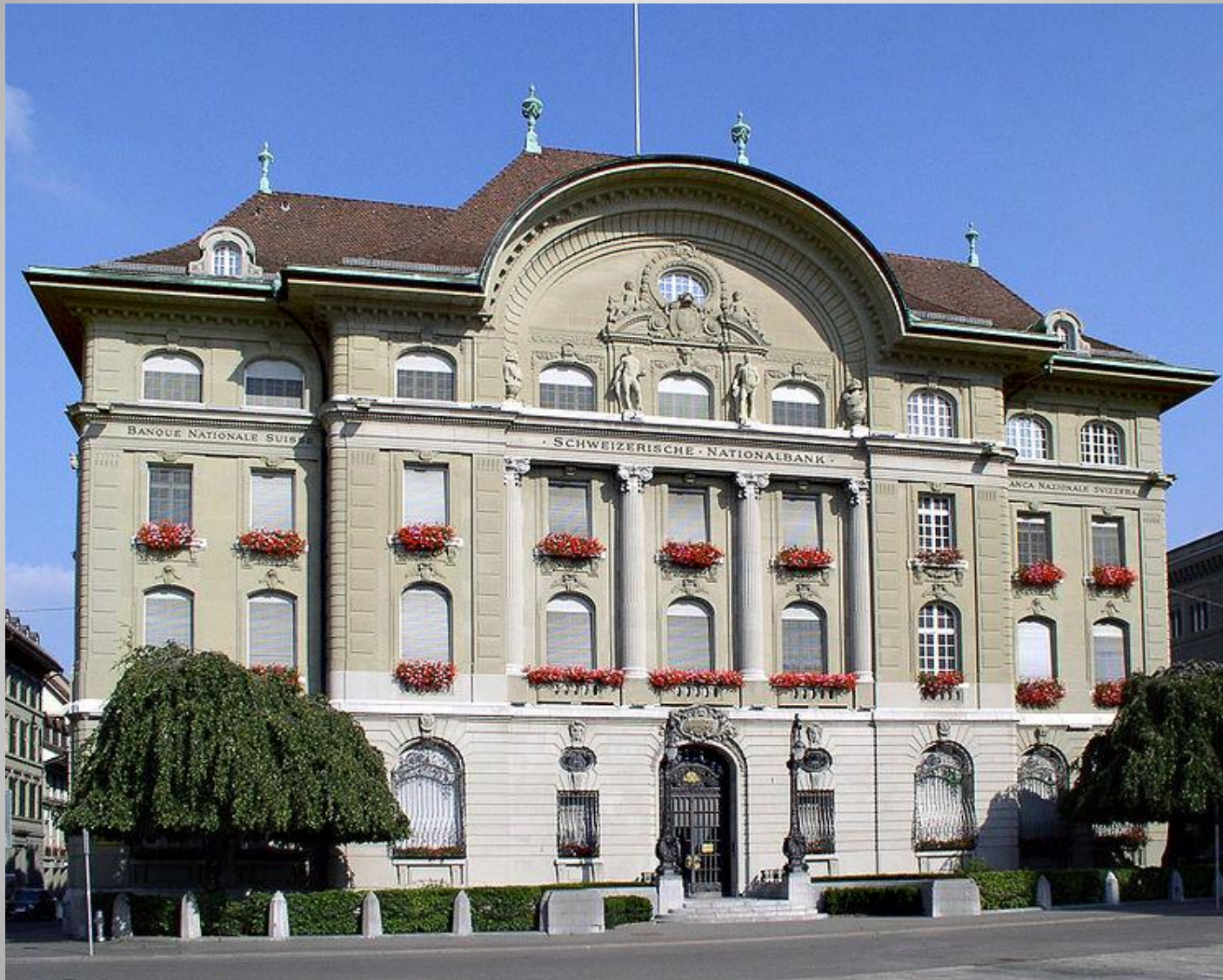
Банк в Швейцарии