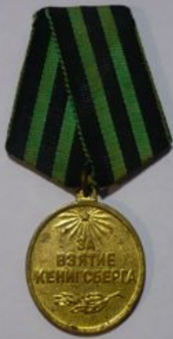
За заслуги в войне прадедущка награжден медалями: «За отвагу», «За боевые заслуги», «За взятие Кенигсберга», «За победу над Германией», «За победу над Японией».