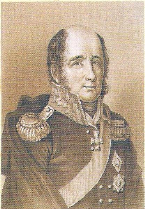
М.Б. Барклай-де-Толли. Гравюра 1820-х гг.

Сайт: «Сообщества взаимопомощи учителей Pedsovet.su»