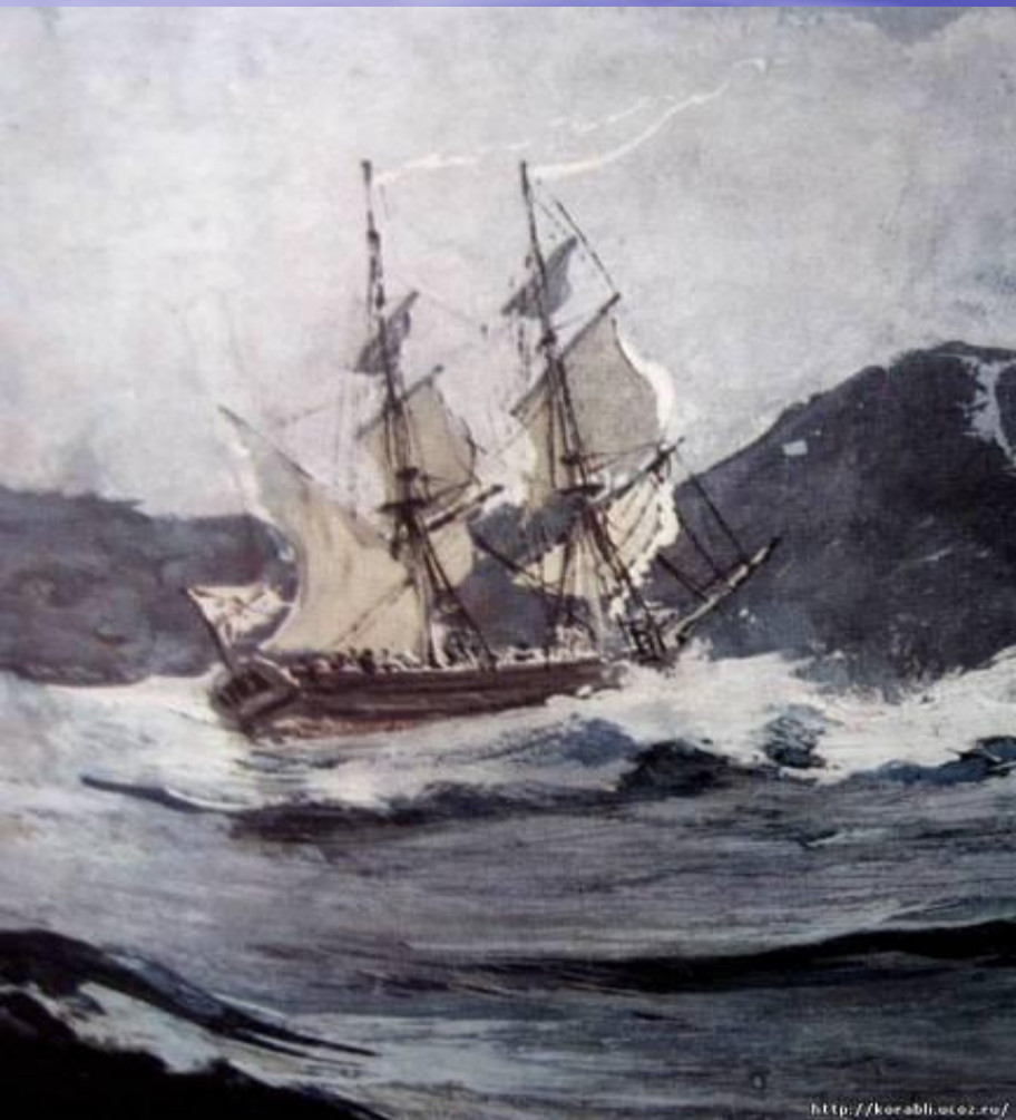
пакетбот «Святой Павел»