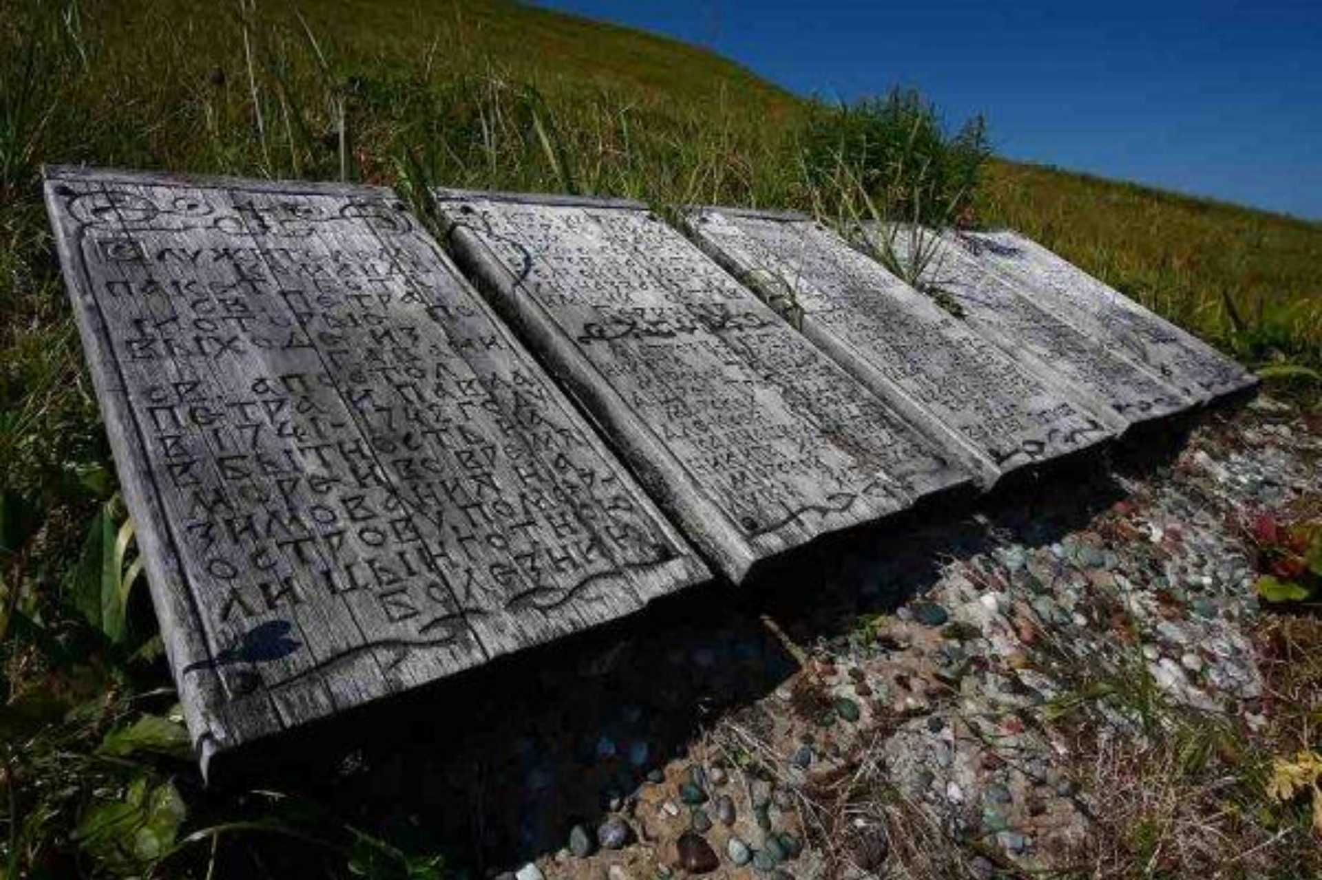
Памятные доски с именами моряков из команды Витуса Беринга