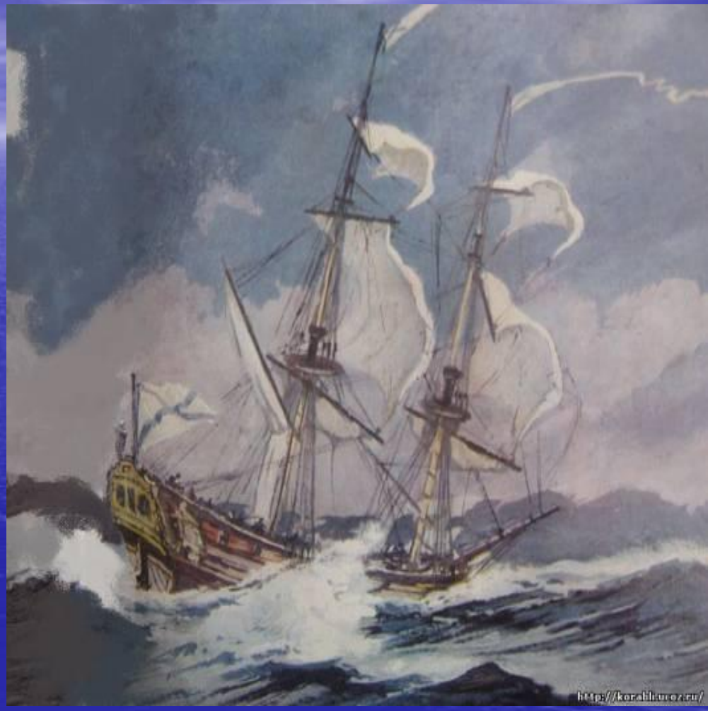
пакетбот «Святой Пётр»