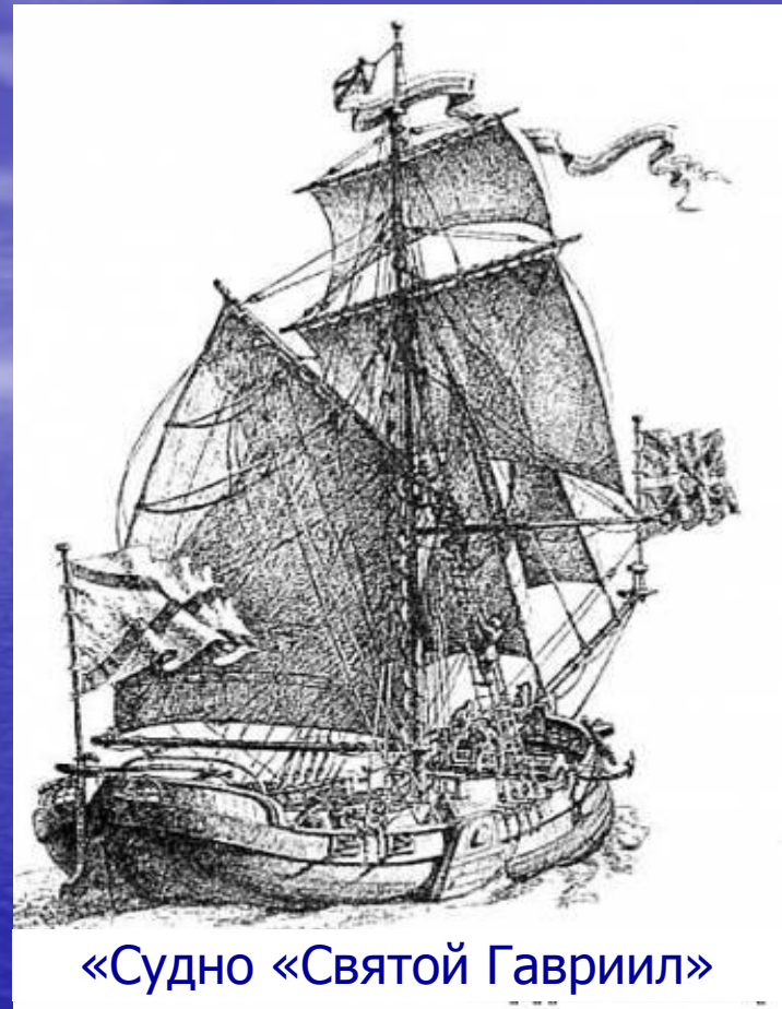
«Судно «Святой Гавриил»

Великий Петр I приветствовал дела, которые приносили мировую известность государству Российскому, и поэтому легко согласился на организацию экспедиции, предложенную голландскими учеными. Экспедицию, которая состояла из 100 человек, возглавил капитан 1 ранга Витус Беринг . Группе надлежало прибыть в район Камчатки, соорудить судно под названием « Святой Гавриил », достигнуть берегов Северной Америки и оставить о своем пребывании там память.