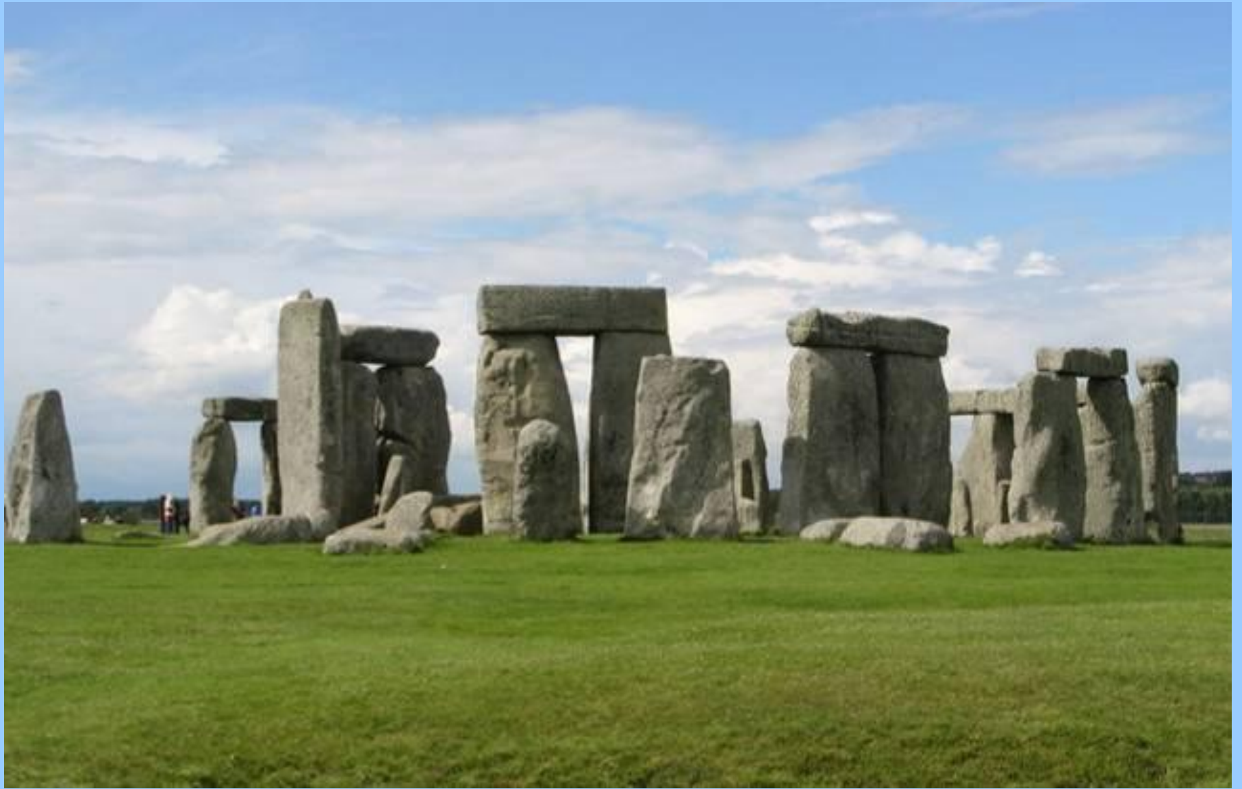
Доисторическое собрание каменных глыб - Стоунхендж