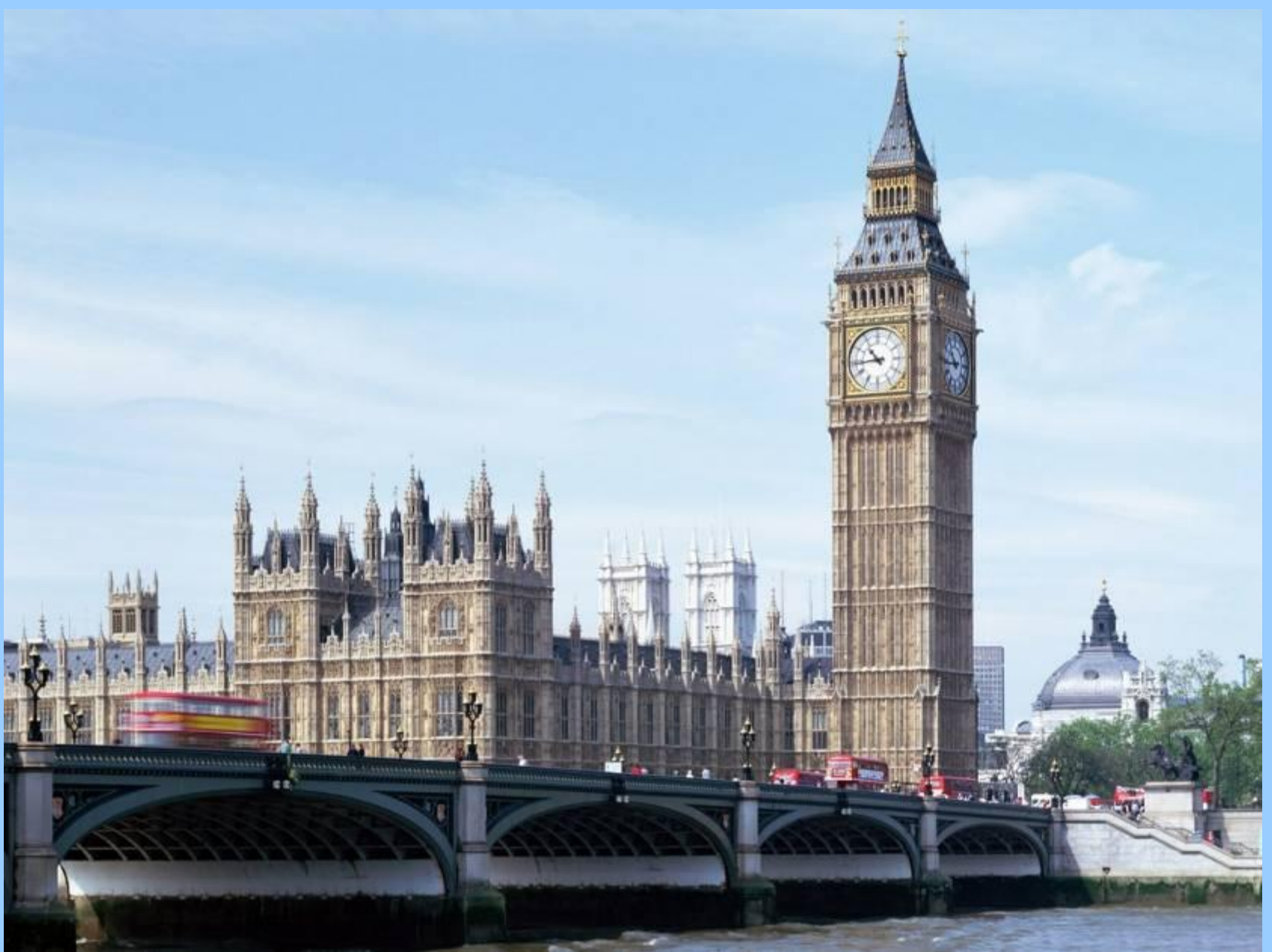
Старинная башня с часами Биг Бен (Big Ben)