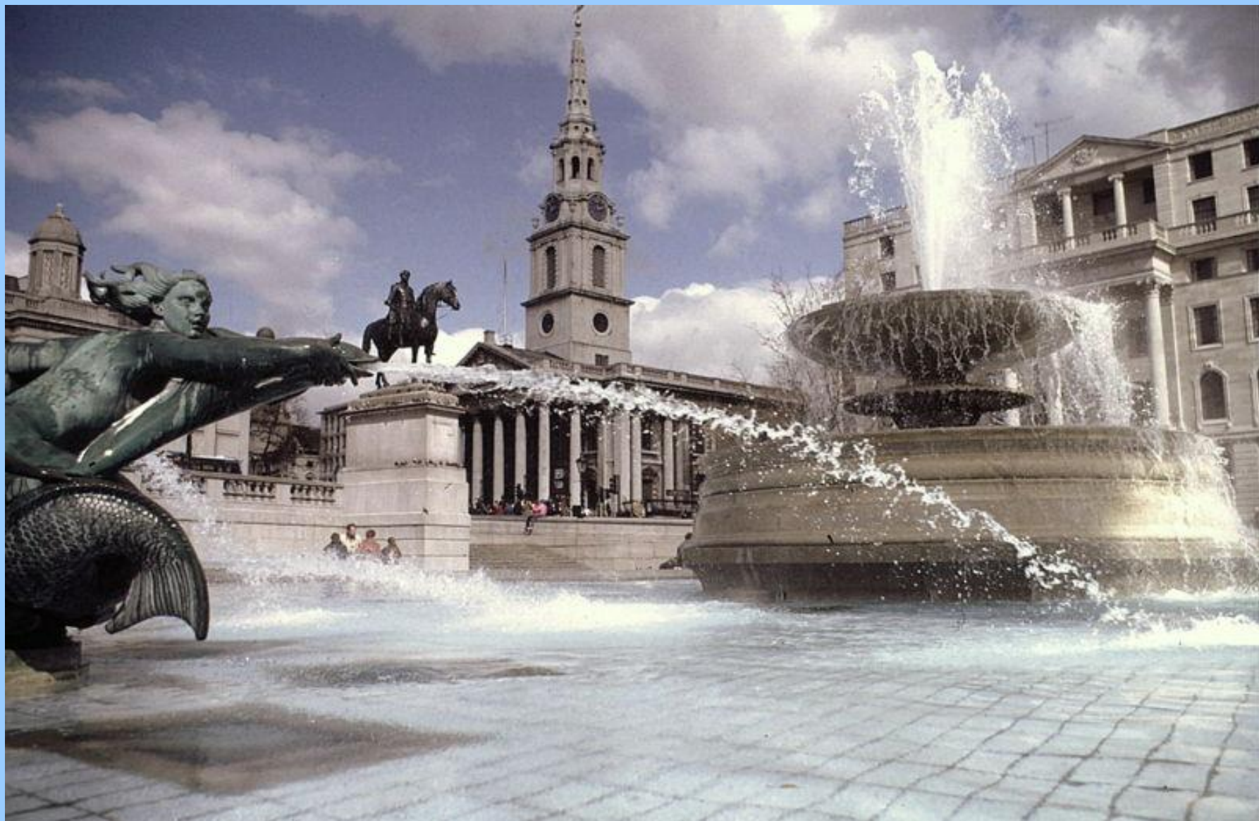
Достопримечательности Великобритании - Трафальгарская площадь