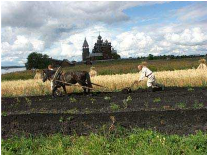
ВЕНЕЦИАНОВ «НА ПАШНЕ»