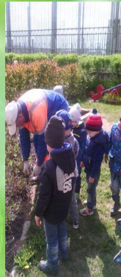
Наблюдение за работой дворника