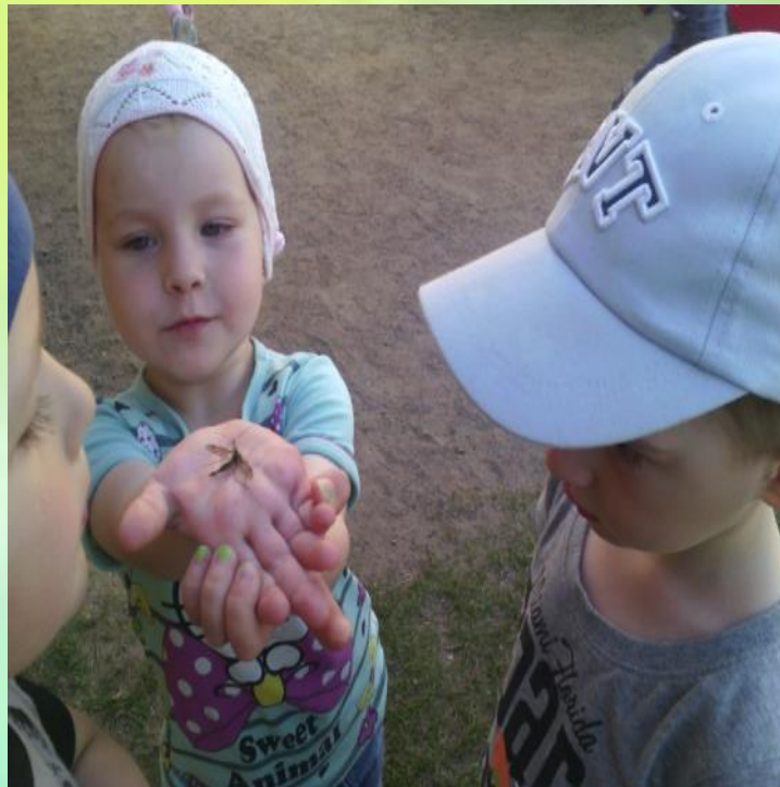
Наблюдение за насекомыми