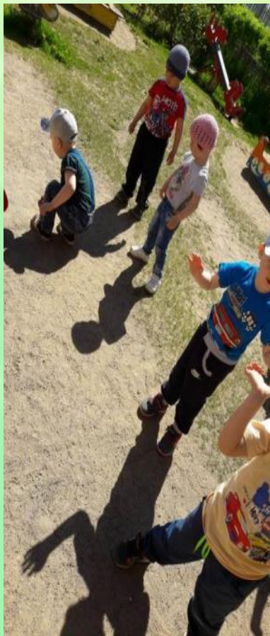
Наблюдение «Моя тень»