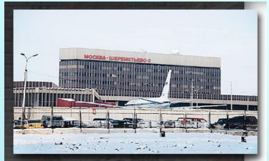
аэропорт Шереметьево-2 г. Москва