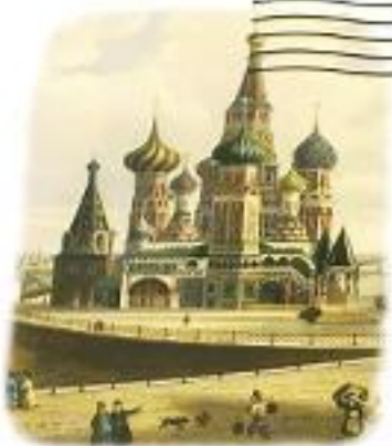
СВЯТЫЙ БАСИЛЬ В МОСКВЕ