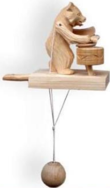
Игрушка с движением