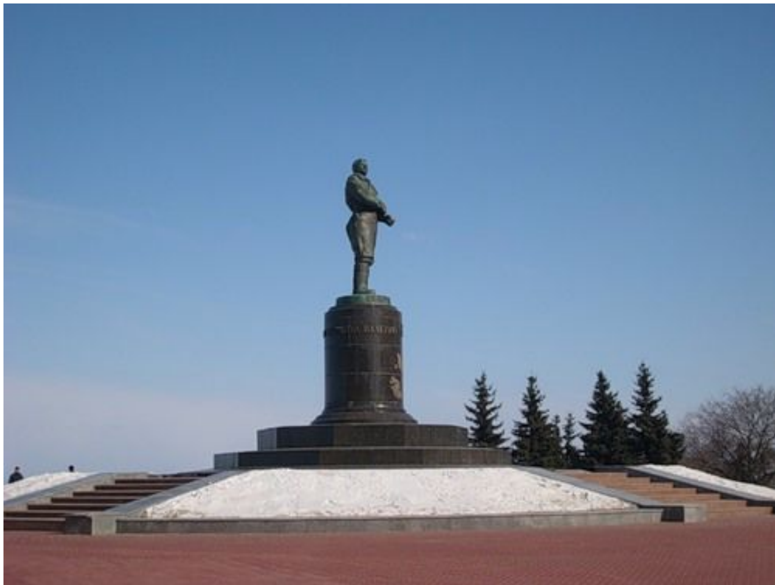
Вечный полет... (Памятник В.Чкалову )