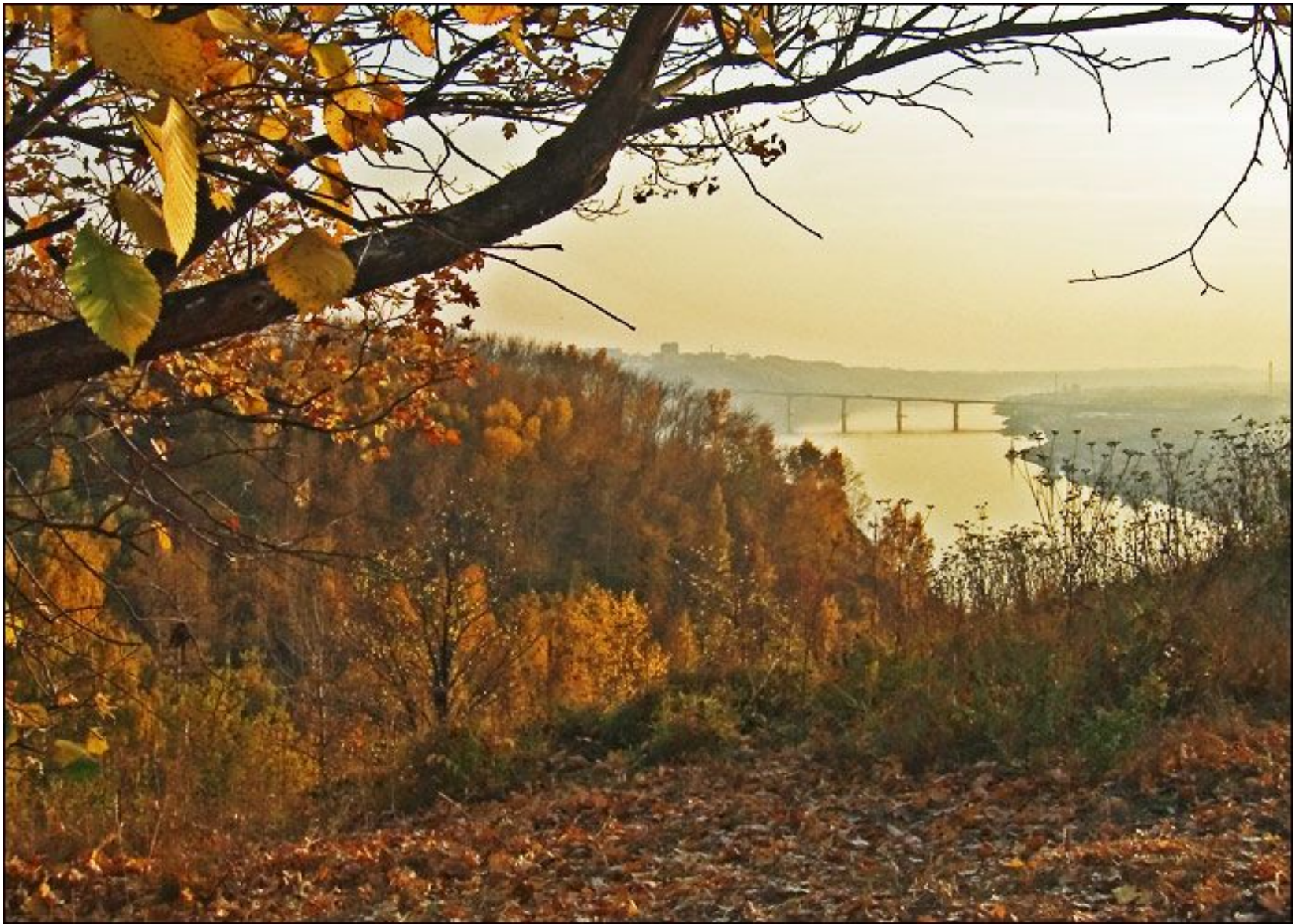
Мызинский мост. Вид из парка «Швейцария»