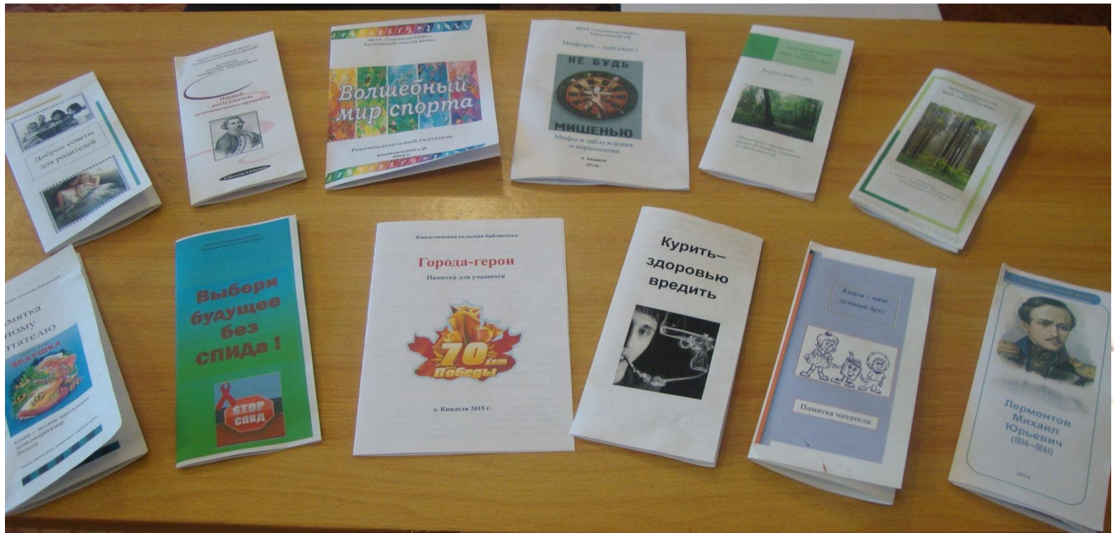
Визитная карточка Кинделинская сельская библиотека 2015г.

В библиотеке издаются памятки и буклеты по различной тематике