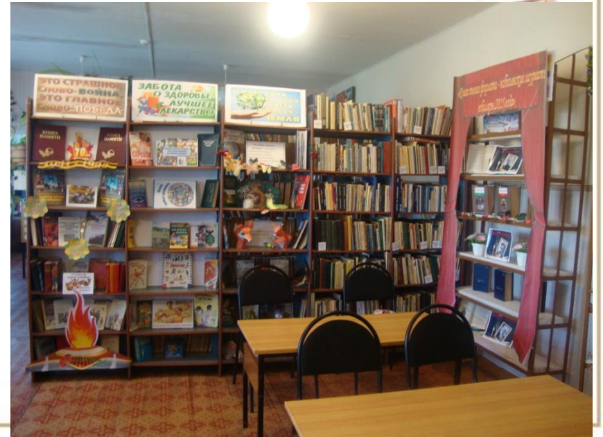
Визитная карточка Кинделинская сельская библиотека 2015г.