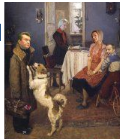
ОПЯТЬ ПО ГЕОГРАФИИ ?