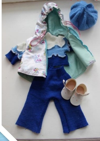
одежда для уборки