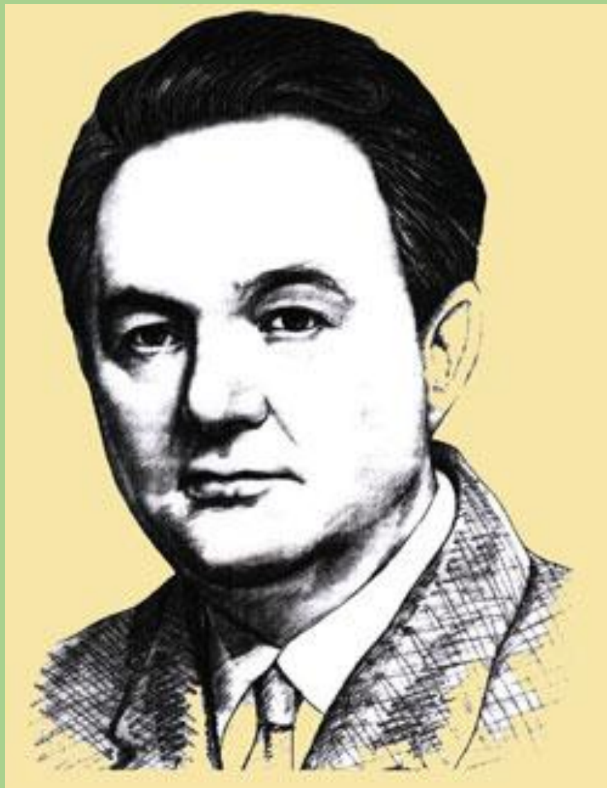
Николай Иванович Сладков