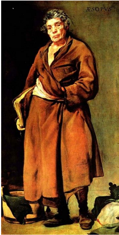
Эзоп (620-560 до н. э.)