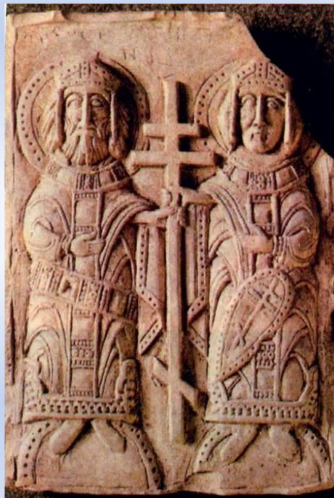
XII век, Полоцк