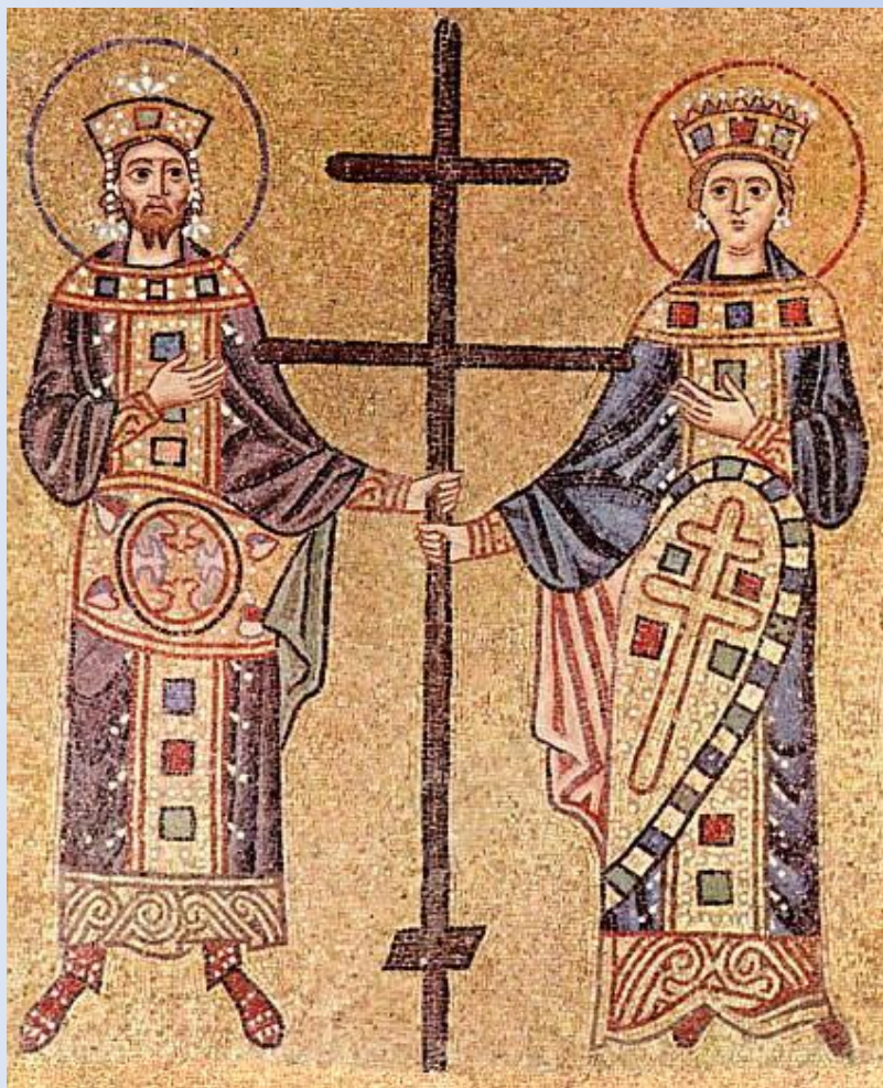
Иконы и фрески