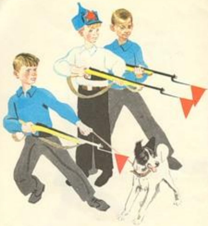
Бесшумною разведкою – тиха нога -