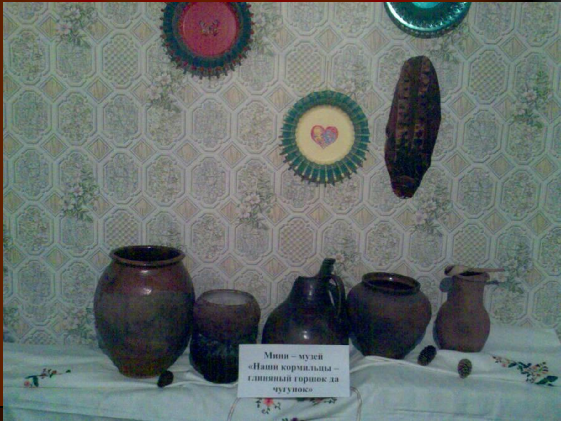
Мини – музей «Наши кормильцы – глиняный горшок да чугунок»