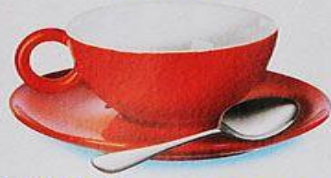
ЧАЙНАЯ ЛОЖКА БЛЮДЦЕ