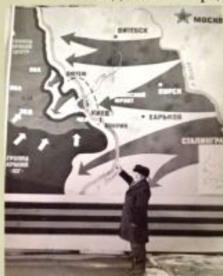
Прадедушка у карты, на которой изображен его «фронтной путь»

За смелость и отвагу прадедушка награжден множеством медалей и орденов, среди которых Орден Отечественной войны I степени. Краеведческий музей его родного города хранит память о нем. После войны и до пенсии прадедушка работал в милиции.