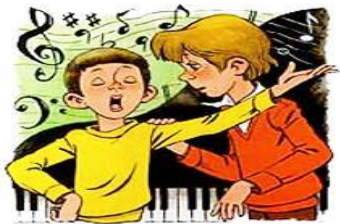
«Где это видано, где это слыхано»