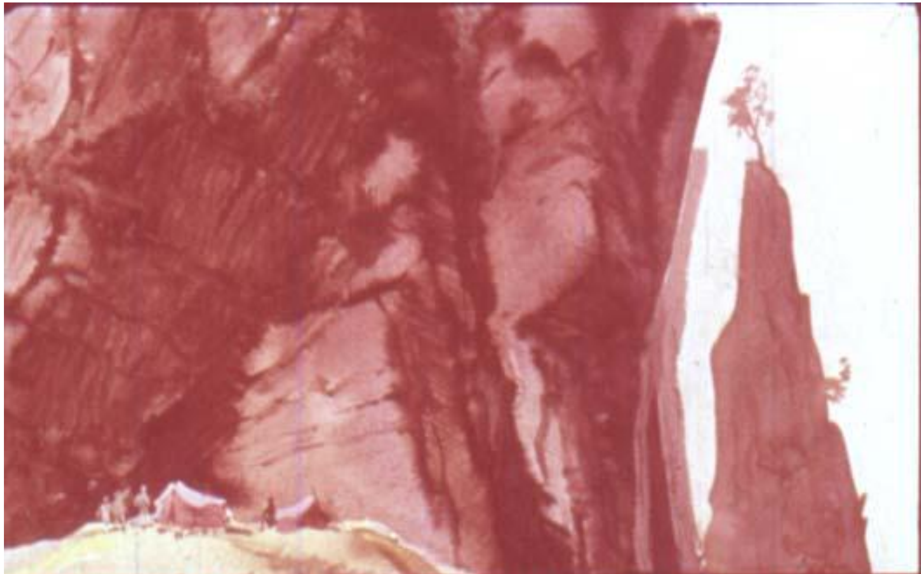
К концу следующего дня путешественники разбили лагерь у подножия скалистого плато с отвесными стенами высотой в добрую тысячу футов.