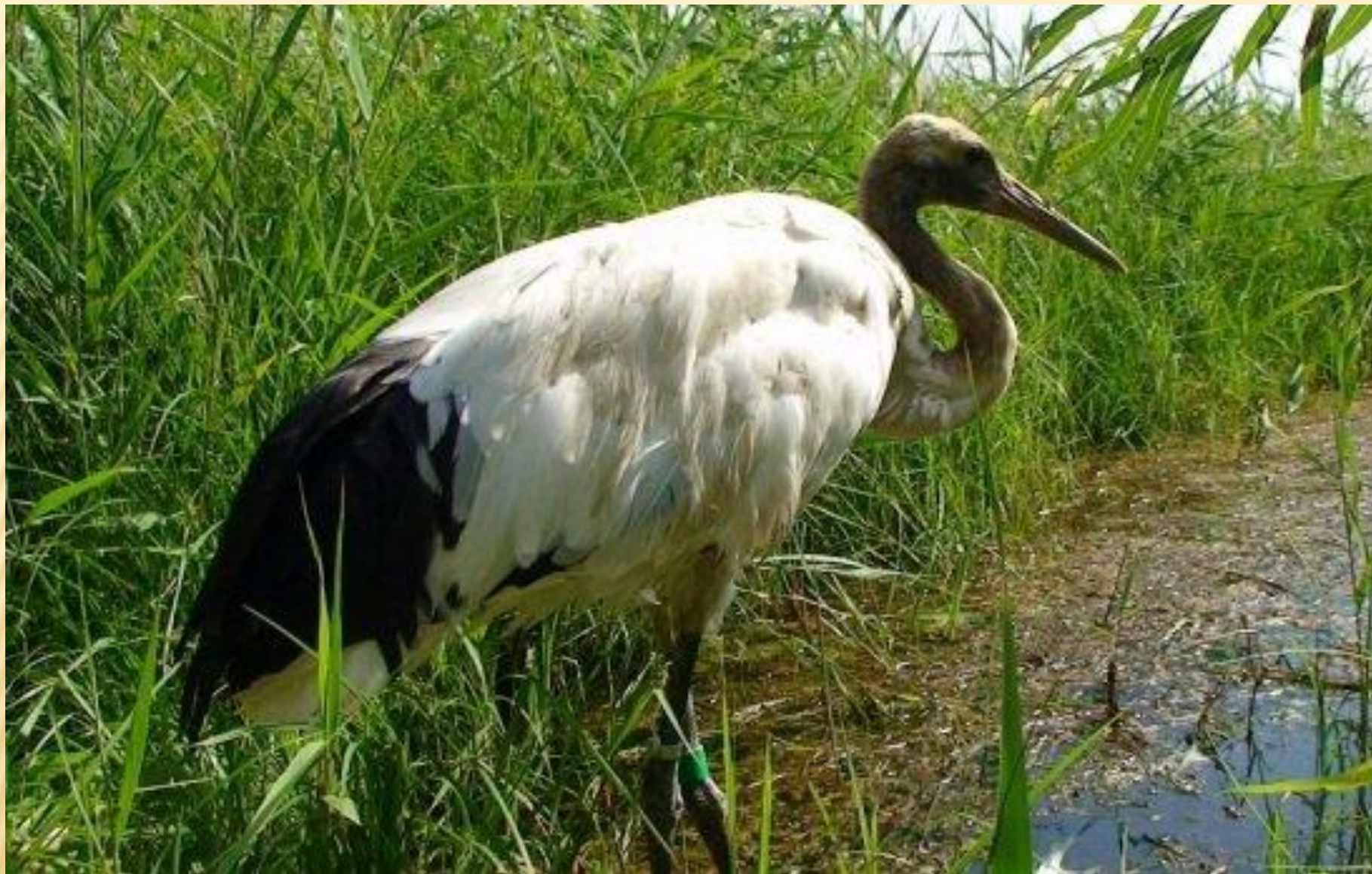
Даурского журавля (занесен в Красную книгу)