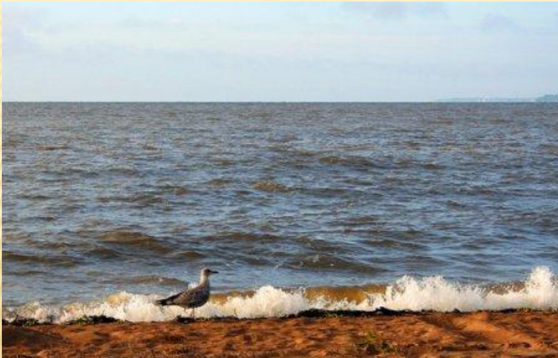
Вид на озеро осенью