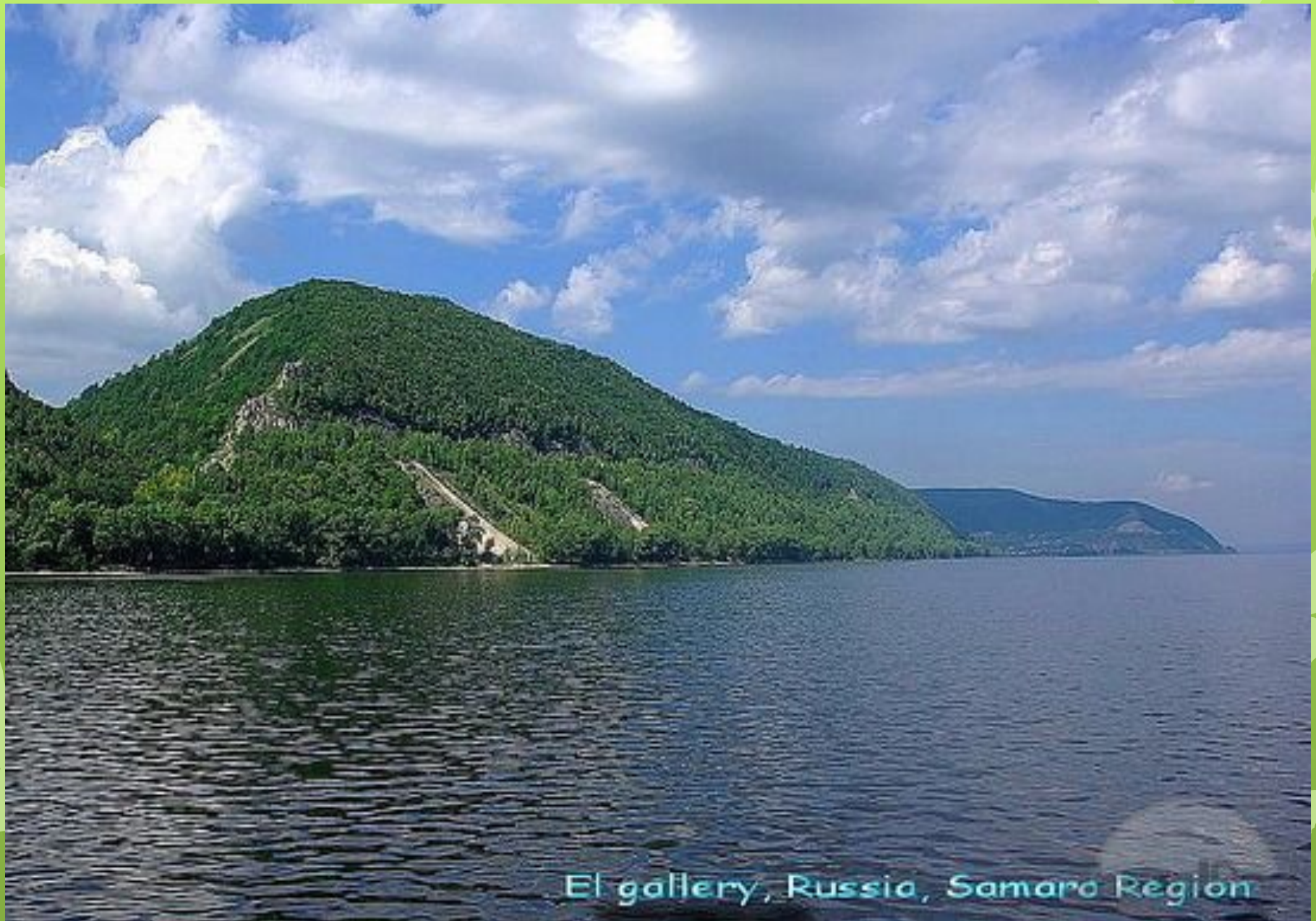
El gallery, Russia, Samara Region