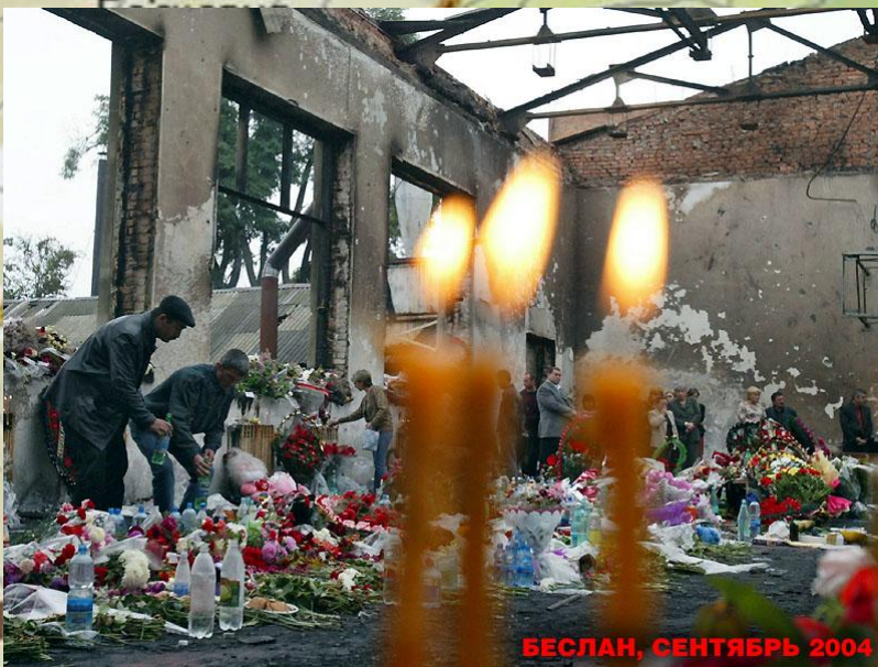
БЕСЛАН, СЕНТЯБРЬ 2004