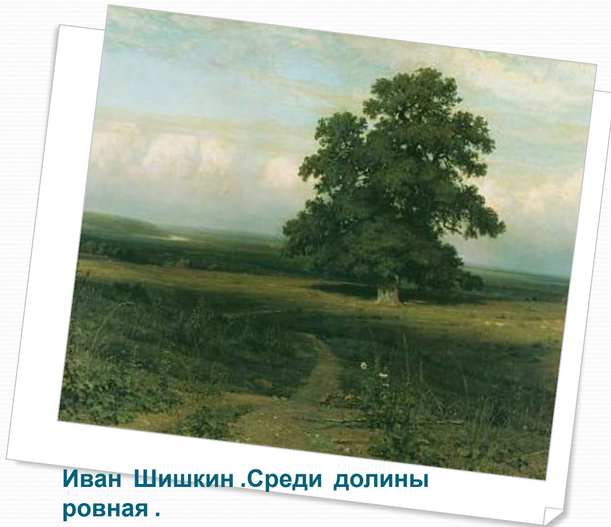
Иван Шишкин .Среди долины ровная .

Среди долины ровная , На гладкой высоте Цветет , растет высокий дуб В могучей красоте .