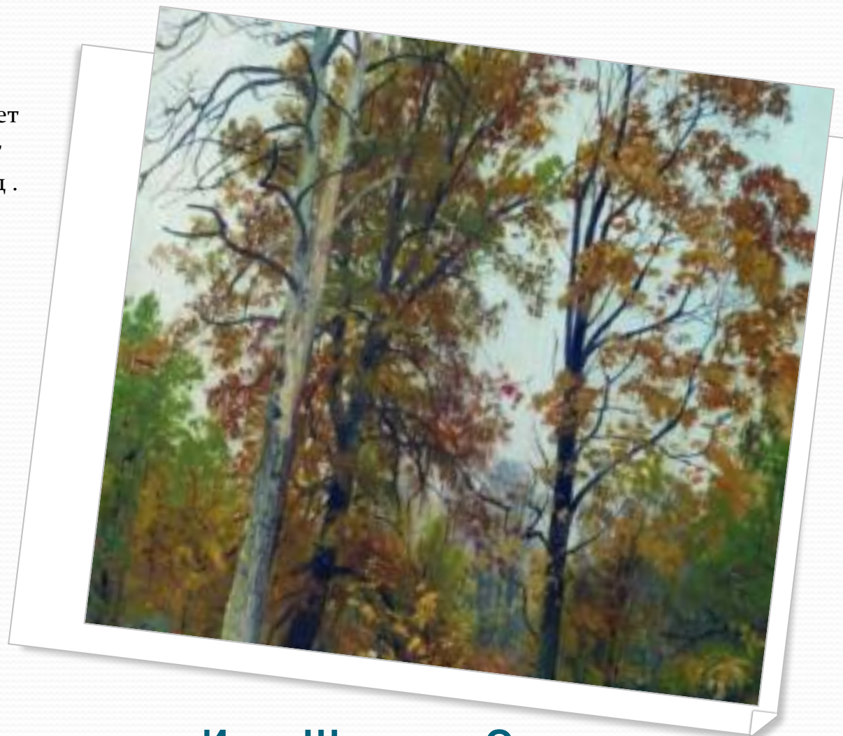
Иван Шишкин . Осень

Сухое дерево притягивает взгляд И вводит непосредственно в сюжет За ним два дерева цветущих стоят Но в кронах виден увядания след .