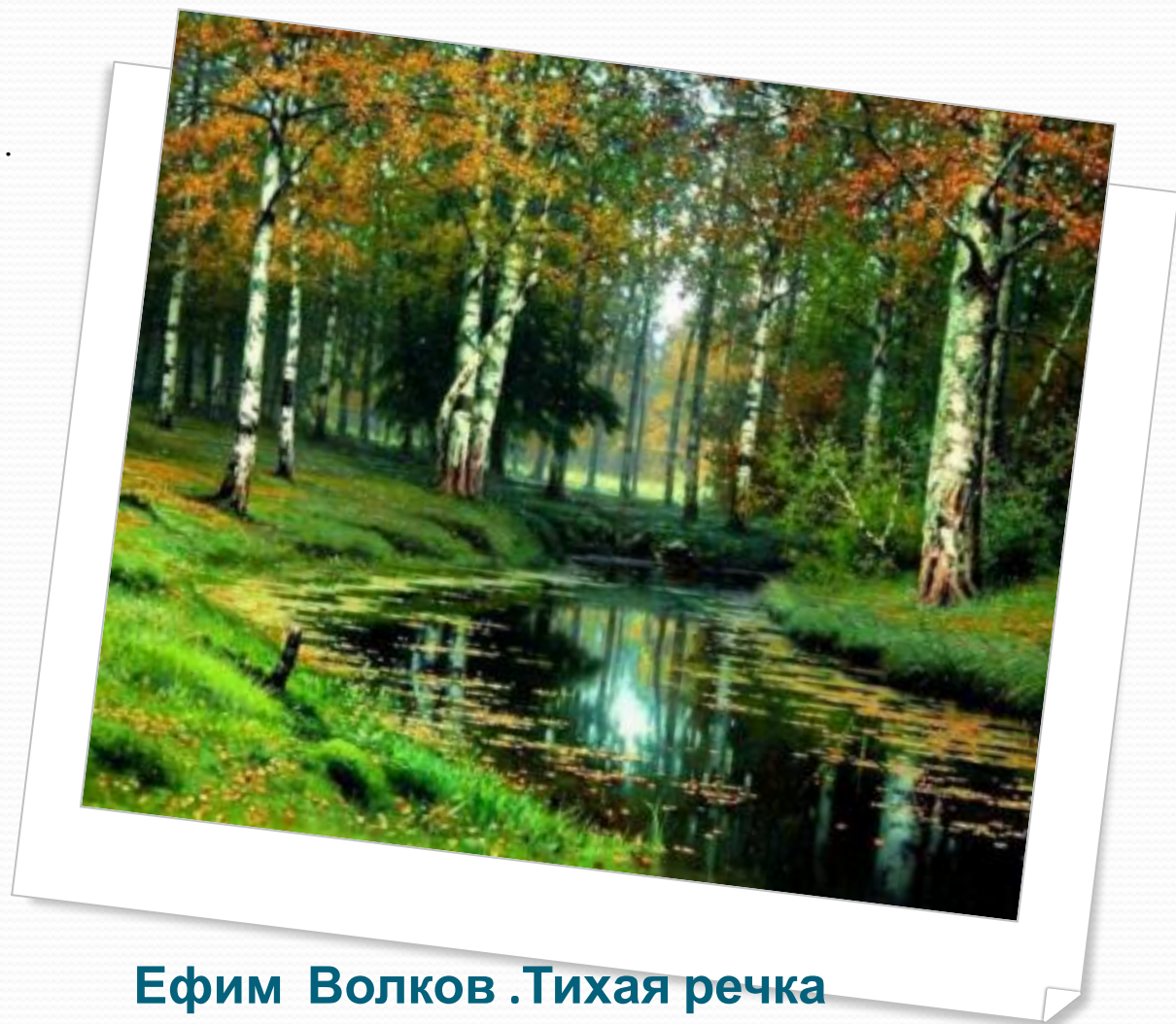
Ефим Волков .Тихая речка

Осень меняет –быстро ! - наряды Зелень – на золото , затем –на багрец . Покрасоваться берёзоньки рады В ярких нарядах осенних невест .