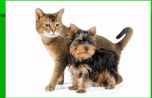
Кошки и собаки