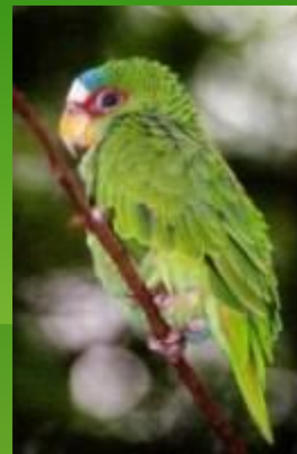
■ Белолобый амазон