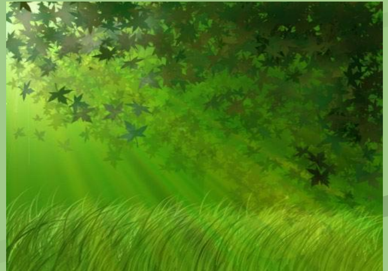
a green fairy tale