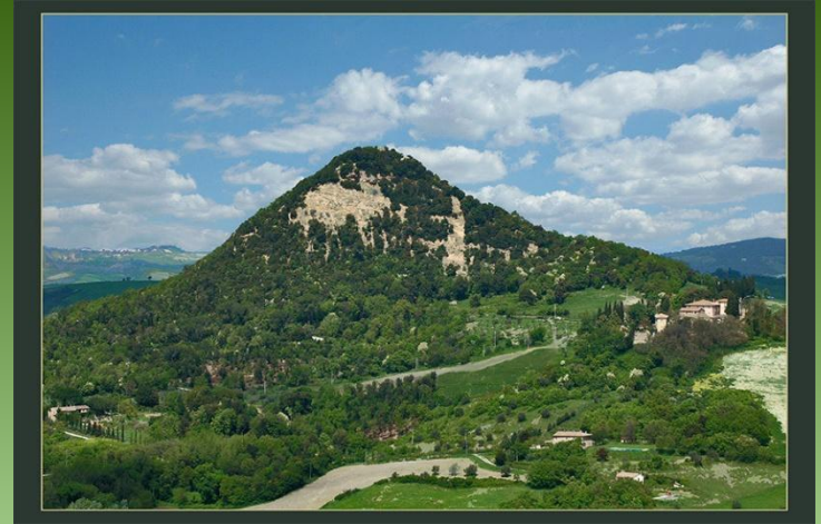
a green mountain