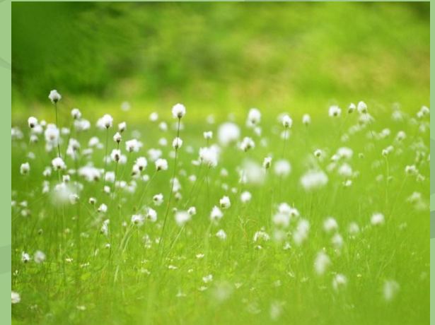
a green field