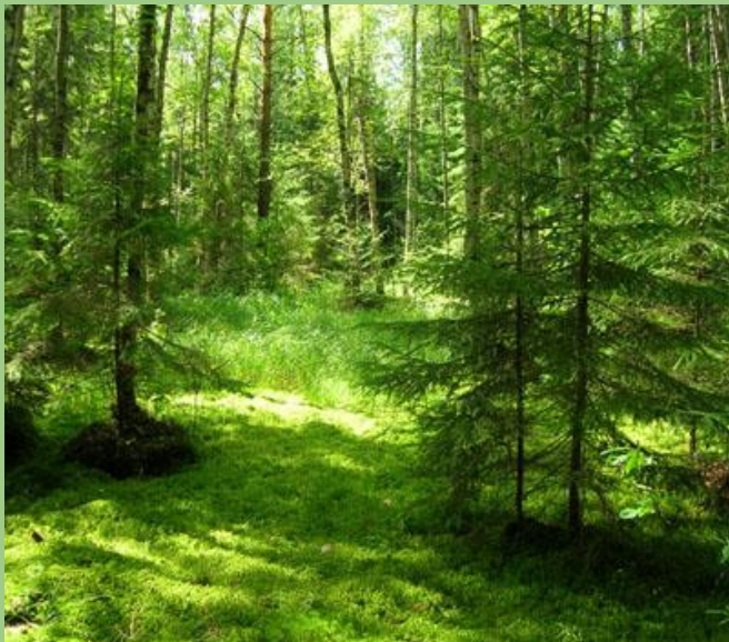
a green forest