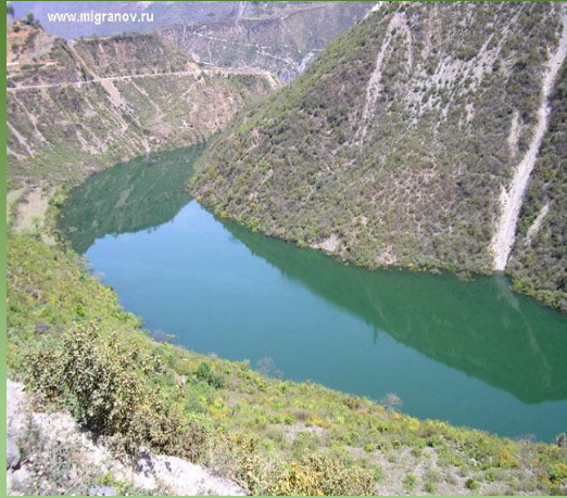
a green river