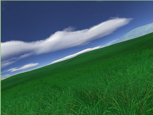
a green grass