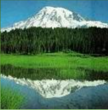
a green island